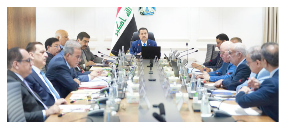
اجتماع رئيس الوزراء يترأس اجتماع المجلس الوزاري الاقتصادي

المجلس الوزاري قرر رفع المنع عن إستيراد البيض الفلاحية، وإطلاق مستحقات الفلاحين بشكل فوري، إلى جانب رفع حظر إستيراد البيض المأمدة، ضمن حزمة قرارات تهدف إلى دعم القطاع الزراعي وضبط أسعار المواد الغذائية في الأسواق المحلية. وقال بيان تلقته (الزمن) أمس إن (رئيس حكومة تكليف الأعمال محمد شياع السوداني، ترأس اجتماع المجلس الوزاري للاقتصاد، حيث ناقش بحضور وزير الزراعة المهندس عبد الحميد الموسوي، عدداً من المواضيع المتعلقة بالقطاع الزراعي والمطالب المستلمة من الفلاحين والمزارعين، والمقررات التي جانب مقررات وزارتي الزراعة والتجارة، فضلاً عن ملف أسعار تسويق محصول الخنطة للعام الحالي وكميات الحصاد وطرق السري وأسعار البذور المحجزة للفلاحين، حيث جرى إقرار مجموعة من التوصيات بهذا الشأن، من بينها تسليم مستحقات الفلاحين بشكل فوري عند تسويق الخنطة). وجدد البيان (دعم الحكومة، لهذا القطاع الحيوي، ودور الفلاحين والمزارعين المحوري في عملية التنمية وتعزيز الاقتصاد، وإنها ماضية في منتهجها الداعم لهم من أجل تحقيق الأمن الغذائي وتوفير فرص العمل المستدامة وتنوع الاقتصاد). وأوضح البيان إن