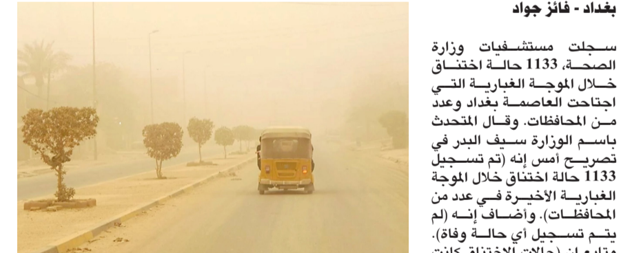
عاصفة : شوارع بغداد كما بدت تحت موجة غبار عاصفة

التفسيبة الناتجة عن استنشاق الغبار، وأشار المصدر إلى إن (مديرية المرور في الأنبار كانت قد حضرت المواطنين من الخروج إلى الشوارع، ودعت إلى البقاء في المنازل بسبب شدة العاصفة الترابية التي تسببت بانعدام الرؤية بشكل كامل وتوقف حركة السير في عدد من الطرق الرئيسية). كما خلفت العاصفة الترابية التي ضربت مدينة الرمادي، أضراراً في عدد من مركبات المواطنين، نتيجة شدة الرياح التي رافقت الحالة الجوية. وشهدت المدينة، تدنياً في مدى الرؤية الأفقية، ما تسبب بحالة من الارتباك في حركة السير. وكانت مديرية مرور العامة، قد طالبت سائقي المركبات بأخذ الحيلولة والحذر أثناء القيادة، بسبب موجة رياح شديدة مصحوبة، في تطور. رجحت الهيئة العامة للأنواء الجوية والرصد الزلزالي التابعة لوزارة النقل، إن يكون طقس