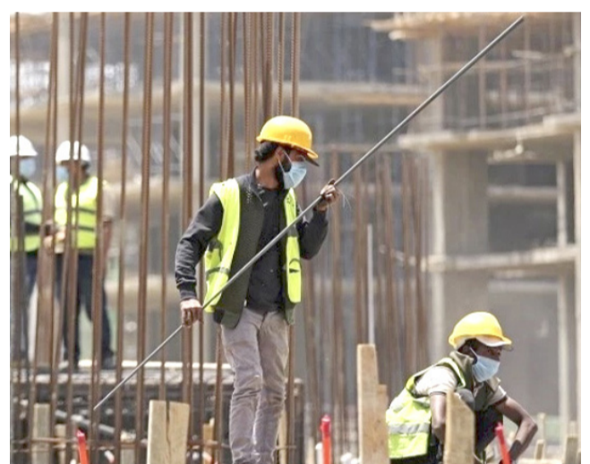
مشروع: عمال اجانب في مشروع