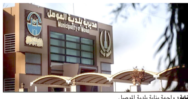
بنائية: واجهة بناية بلدية الموصل

لقد عاش الشارع العراقي أشهراً من الترقب، واكب خلالها اجتماعات ماراثونية وصراعات داخلية وبيانات متضاربة لقادة الإطار التسقيفي. وفي غمرة هذا الحراك، ذهب الإعلام المحلي والدولي إلى رسم سيناريوهات وحصر الأسماء في دائرة ضيقة ضمت (السوداني، المالكي، العوادي، والبدري).