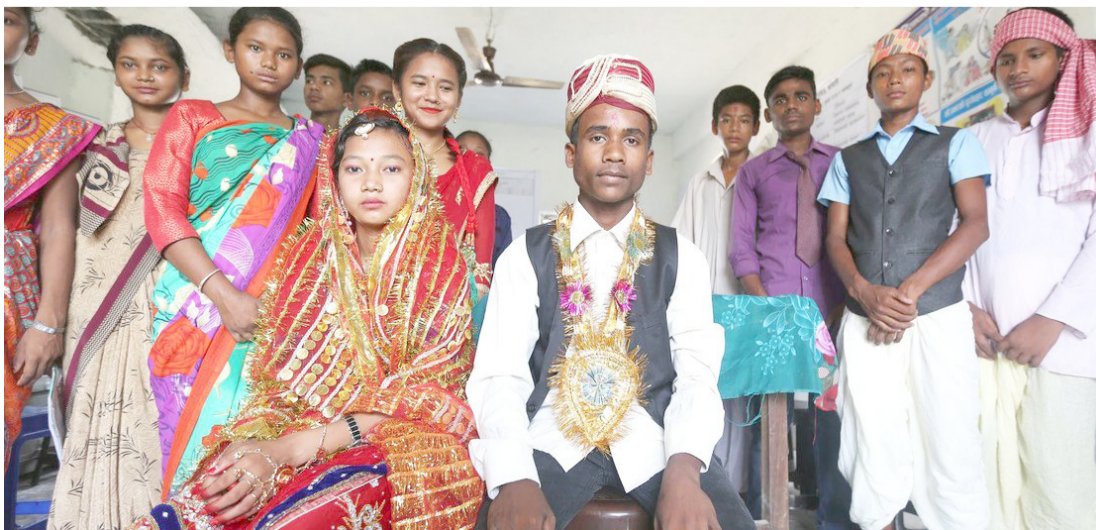
زواج: حفل زواج الأطفال في باكستان

زواج القاصرات في 30 مايو أيار 2025 ، دخل قانون تقييد زواج الأطفال في إقليم العاصمة إسلام آباد حيز التنفيذ ، محمداً سن الثامنة عشرة كحد أدنى قانوني للزواج ، ومجرماً زواج القاصرات ، جاء هذا الإصلاح عقب حكم أصدرته المحكمة الدستورية الاتحادية عام 2023 ، أيد سن الثامنة عشرة كحد أدنى صحيح ،