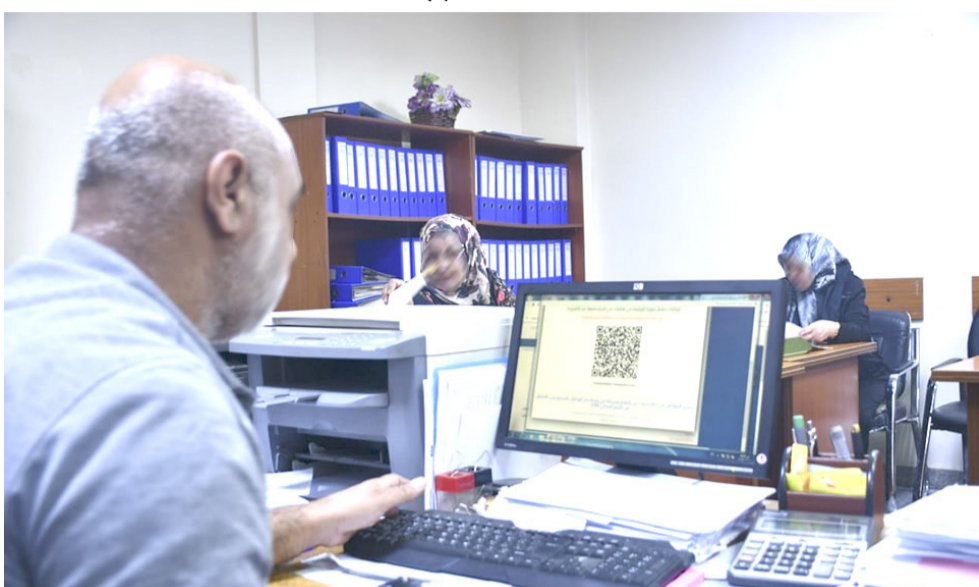
باركود: موظف في كاتب العدل يقوم بطباعة رمز الاستجابة السريع (الباركود)

اي رسوم إضافية غير منصوص عليها قانونياً. مطالبين بـ (تبسيط) الإدارية ويفتح باباً لاجتهادات غير منضبطة. مشددين على إن (استمرار هذه التعقيدات يعكس) سلباً على بيئة الأعمال وحركة (الاستثمار). ولفت المواطنون إلى إن (التأخير في إنجاز المعاملات بسبب) خسائر مباشرة لشرايح واسعة من (التجار وأصحاب الشركات. الذين) يعتمدون على الوكالات في إتمام (معاملاتهم اليومية). فجوة الثقة محذرين من إن (بقاء الإجراءات) الحالية دون مراجعة. قد يدفع إلى (اتساع فجوة الثقة بين المواطن) والمؤسسات العدلية. لاسيما (مع تكرار شكاوى المراجعين من) عدم وضوح التعليمات وتعدد (التفسيرات داخل الدوائر ذاتها). ودعا المواطنون إلى (اعتماد نظام) إلكتروني موحد وفعال يضمن (قراءة الباركود وتحديث البيانات) دون الحاجة إلى مراجعات متكررة. مع وضع ضوابط دقيقة تمنع فرض (الاعتماد على الإجراءات الورقية).