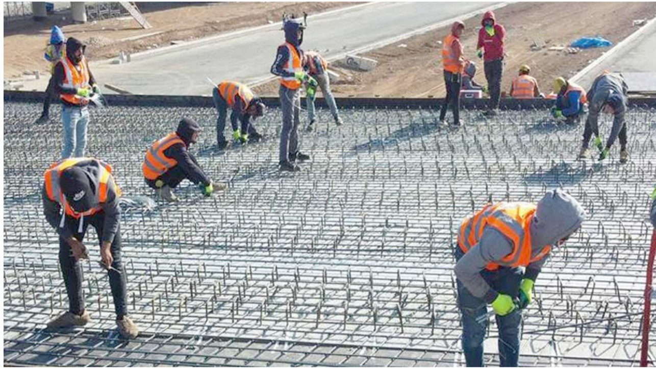
مشاريح: شباب يعملون في مشاريع كبرى في كردستان

المحافظات وفق تقييم الأمانة العامة، في ظل دعم واهتمام الحكومة المحلية بهذا القطاع. التطوعي في عدد من المحافظات، وذلك عقب تصدُر البصرة المرتبة الأولى في العمل التطوعي لعامي 2024 و2025.