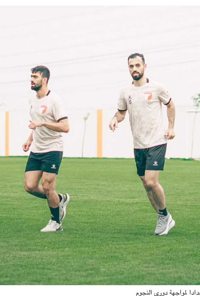
تدريبات: فريق الكرامة يجري تدريباته استعدادا لمواجهة دوري النجوم

الناصرة، باسم الركابي يتطلع الوصيف للشرطة 67 باهتمام كبير الى مباراته امام ضيفه التاسع نروروز في افتتاح الجولة 33 من دوري النجوم لكرة القدم اليوم الاثنى خوضها بثقة والتركيز على الفوز عند هذا المستوى بعد بروفة ناجحة بإيقاف النفض والتطلع بنسبغ لتجاوز تحديات مواجهة السليمانية الغير سهلة امام فريق اصبح اكثر قوة وانسجام ويتمتع بثقة كبيرة ويمر في افضل ايامه وملعب صعب لكن تبقى عين الشرطة الذي يمتلك خطوط قوية على تحقيق الفوز عبر تسخير قدرات عناصره في تقديم كل ما عندها ومواصلة السير في طريق الانتصارات فوز الفريق وتعثر المتصدر برقع من سقف الصراع على الصدارة وتأكيد ان الفريق ازال احد المرشحين للقب ويقدم عملا واضحا ومحاولة حسم الامور بافضل طريقة والتشديد على ملاحقة المتصدر سيما والدوري يدخل مرحلة حاسمة بتعين على جميع الفرق خوض آخر المباريات بحدس شديد لأهمية ذلك على واقع تحديد المركز في نهاية المشوار وامر الشرطة بتعلق على نتائج اخر ستة جولات من نهاية