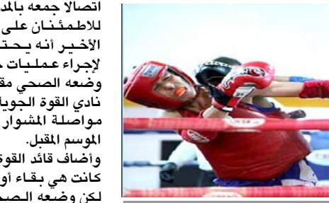
أحدى مناسبات المراتي الحلية

بغداد- الزمان اعلنوا على دعمهم وتواجدهم في البطولة، مشيرين إلى أن بطولة النخبة قار على استضافة الأحداث الدولية وعازم على انجاح البطولة بكل المجالات. وأشار إلى أن بطولة العراق لمنتخبات المناطق كانت بروفة