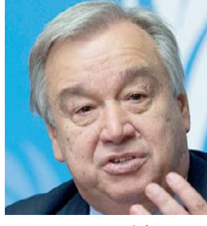
أنطونيو غوتيريش يقف الشباب في الخطوط الامامية للضمان من أجل بناء مستقبل أفضل للجميع. وقد سلطت جائحة كوفيد-19 الضوء

على الحاجة الماسة إلى تحقيق ما يسعى إليه الشباب من تغيير مضم إلى التحول - ويجب أن يكون الشباب شركاء كاملين في هذه الجهود. ويبرز اليوم الدولي للشباب هذا العام الحلول التي طورها المتكثرون الشباب لمواجهة التحديات التي تواجه مخفوماتنا الغذائية. وتعالج هذه الحلول أوجه عدم المساواة في الأمن الغذائي، وفقدان التنوع البيولوجي، والتحديات التي تتعرض لها بيئتنا، وأكثر من ذلك بكثير. وتحزن نرى نفس الدافع والإبداع والإلتزام في العديد من المجالات الأخرى - من المساواة بين الجنسين إلى التعليم وتمثية الهامات. غير أن الشباب لا يمكنهم القيام بذلك بمفردهم، فهم بحاجة إلى حلفاء لضمان إعطائهم دوراً فاعلاً، وعدم إقصائهم، وفهم آرائهم. وتستعرض الأمم المتحدة باستراتيجية شباب 2030 وهي استراتيجية الشباب على نطاق منظومة الأمم المتحدة، لتحترز عليها من أجل الشباب ومعهم في جميع أنحاء العالم. واحت الجميع على ضمان أن يكون للشباب مقعد على الطاولة بينما نبني عالمنا قائماً على التنمية الشاملة والعدالة والمستمدة للجميع. وشكراً لكم. لا تعليق على ما يقوله الأمين العام سوى الاستفسار عن أية جهود تتحدث عنها وهل يقبل من يديهم الامر أن يكون للشباب مقعد على الطاولة! ياسيدي لقد سرقوا كل المقاعد ولم يعد