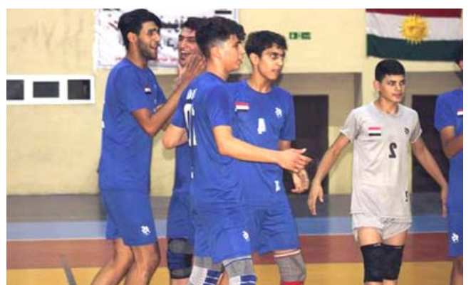
طائرة : تدريبات المنتخب الوطني بالكرة الطائرة

مستويات اللاعبين وقلبيص القائمة إلى اربعة عشر لاعبا فقط والثاني مدير الفريق الاستاذ وسيسعى لاندو نوريس سابق مكلاين لإنهاء السباق بين أول خمسة مراكز للمرة الثامنة في تسع جولات هذا الموسم فيما يحتاج زميله الأسترالي دانييل ريكاردو إلى تحسين مستواه بعد بدايته الصعبة مع الفريق. وفي الخلف يملك جورج راسل سائق ويليامز فرصة تعويض خيبة أمل الأحد الماضي عندما انسحب من السباق بعد انطلاقه من المركز العاشر وكان في طريقه لحصد النقاط للبطل السابق لأول مرة في نحو عامين. وستجلب بريلي إطارات أكثر ليونة عن سابق الأوراق فيما يتعلق بالاستراتيجية أمام جماهير أكبر من السابق الماضي كما ستكون درجة الحرارة