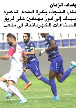
كرة : منافسات الدوري الممتاز بكرة القدم

بغداد- الزمان قلب النجف بكرة القدم تأخره بهدف إلى فوز بهدفين على فريق الصناعات الكهربائية، في ملعب