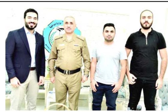
جرائم: مشاهد من حلقة (كلام الناس) عن الاتجار بالبشر