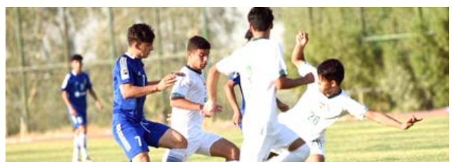
قوة : لقاء منتخب الناشئين مع شباب القوة الجوية

ستشهد إجراء عدد من المباريات التجريبية للوقوف على جاهزية اللاعبين من الناشئين الفنية والبدنية، ناشك عن غرس المفاهيم الخططية لديهم مع تهئية اللاعبين ذهنياً ونفسياً قبل الولوج لمعترك البطولة العربية. واختتم مدرب