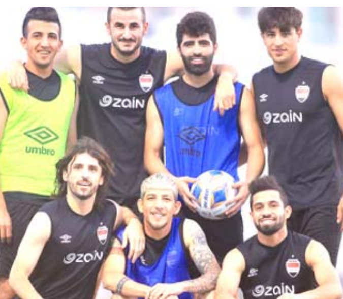
طموحات : لاعبي المنتخب الوطني يجيرون عن طموحاتهم في التأهل إلى الموندباليال

تتمثل فرصة أخيرة لعدد من اللاعبين ولجبل من المنتخب الوطني وعلينا استخثار هذه الفرصة لنخندد أسمائنا مثلما فعل جبل 1986 من خلال الاجتهاد والمثابرة، ونتمنى أن تكون الظروف ماثلة لخطف بطاقة موندباليالية. يشار إلى أن منتخب العراق سيلعب ضمن المجموعة الأولى بتصفيات كأس العالم إلى جانب منتخبات إيران وكوريا الجنوبية والإمارات وسوريا ولبنان.