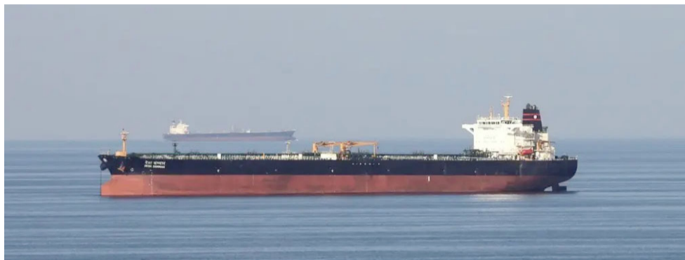
مضيق: حركة الملاحة تواجه صعوبات في مضيق هرمز

مباشر إلى المخازن المخصصة. ووضوح البين ومن ثم إلى الأسواق المحلية، لدعم استقرار الأسعار وتلبية احتياجات المواطنين، فيما يجري التعامل مع الحواسيات والمقالات وفق خطط لوجستية دقيقة تضمن سلامة