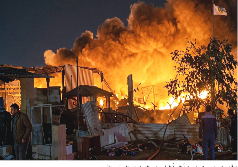
مقر : قصف يستهدف مقراً تابعاً للواء حشد الشبك في ناحية برطلة

أسس إن (الهجوم الأول لم يحقق الهدف)، مضيفاً إن (هجوماً ثانياً سُمع في جانب الكرخ من العاصمة).