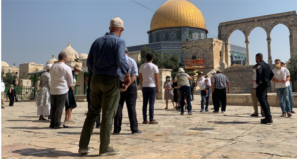
اقتحام: مستوطنون يحاولون اقتحام باحات المسجد الأقصى

حقوق قانونية وقالت المتحدثة باسم وزارة الخارجية الصينية ماو نينغ رداً على سؤال حول القانون في مؤتمر صحافي الجمعة «يجب احترام الحقوق القانونية للشعب الفلسطيني وحمايتها». وأضافت «نأمل أن تسمى إسرائيل «ناصل» أيضاً أن تتوقف الأطراف المعنية عن الأعمال التي تُصعد التوترات وتفاقم النزاع». مشددة على أن «الصين تؤمن بأن أي قانون يجب أن يراعي المبادئ القانونية كالمساواة والعدالة، ولا يُميز على أساس العرق أو الدين أو الجنسية أو الآراء السياسية». وقبول القانون بانتقادات من الأمم المتحدة والاتحاد الأوروبي، بينما دعمت الولايات المتحدة «حق إسرائيل السيادة في تحديد قواعدها الخاصة». وانتقد وزراء خارجية السعودية ومصر والاردن وإندونيسيا وباكستان وقطر وتركيا والإمارات القانون في بيان مشترك رافضة الانتقادات ويعتزم الرئيس الأميركي عقد تجمع في 17 أيار/مايو في واشنطن للصلاة «من أجل الفلسطينيين، مشددين على أن مثل هذه الإجراءات من شأنها تاجيح التوترات وتقويض الاستقرار الإقليمية». ولا تزال الصين تُطبق عقوبة الإعدام ولا تنشر إحصاءات بهذا الصدد. وترجع منظمة العفو الدولية وغيرها من المنظمات الحقوقية أن آلاف الأشخاص يُعدمون في هذا البلد سنوياً.