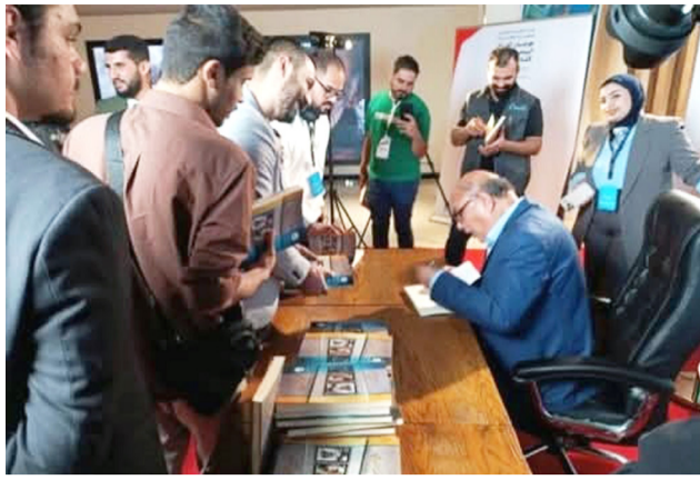
مهرجان: لقطات من مهرجان العراق السينمائي الدولي لأفلام الشباب وملصقات ترويجية لأفلامه