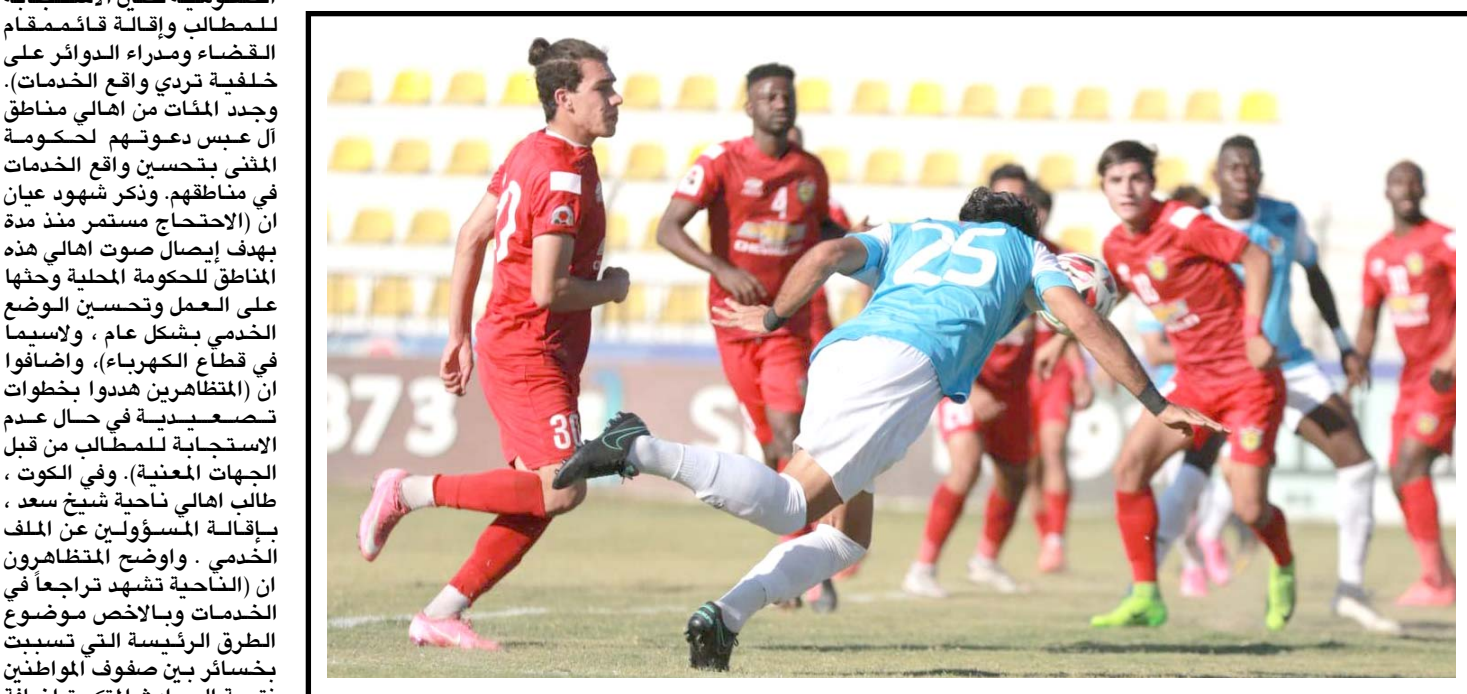
دوري: انطلقت امس الاحد منافسات الدوري الممتاز لكرة القدم بعد توقف نحو شهر بثلاث مباريات في افتتاح الجولة الثانية والثلاثين، التفاصيل على موقع (الزمان) الإلكتروني

بغداد - ياسين ياس أكدت الوزارة الصحة والبيئة، أن دول العالم تراقب مناعة المتلقيح لتحديد صلاحية تجديد لقاح كورونا، مشيرة إلى رصد 4160 إصابة بعد إجراء فحوصات لأكثر من 37 ألف عينة لحالات مشتبه أصابها بالفايروس في عموم المحافظات، وأوضح الموقف البشري اليومي، الذي اطلعت عليه (الزمان) أمس إلى أن (الفحوصات المخبرية التي أجرتها مختبرات الوزارة لحالات مشتبه أصابها بالفايروس بلغت 37 ألفا ، حيث