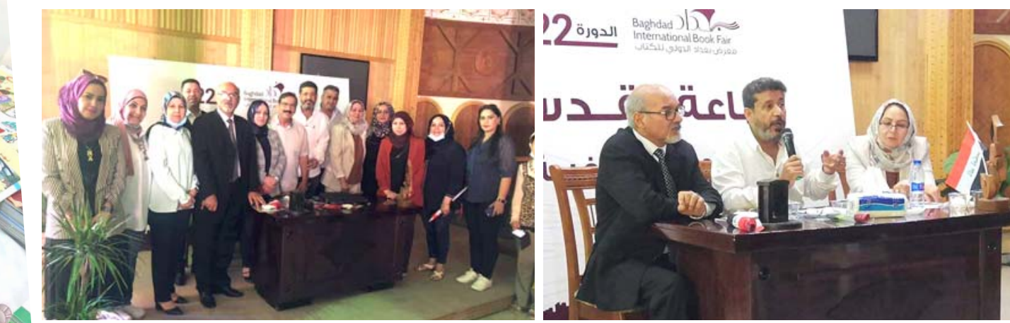
ندوة : لقطات من ندوة عن أدب الأطفال ضمن فعاليات معرض بغداد الدولي

لأدب الطفل حينها ، ولكنها لا تعد التجربة الفنية التي تحتوي على جميع إشتراطات الكتابة للطفل) مشيرة الى ان سبب ذلك هو قلة الخبرة وانعدام الإصدارات في هذا المجال، بعد ان كانت القصص تقريبيه تتحدث عن التلميذ بالدرجة الأولى (شكر تريبوي). وفي نهاية الندوة أكد الحضور ومن خلال المداخلات العديدة على ضرورة تأسيس قناة فضائية تعنى بثقافة الطفل فضلاً عن إفتتاح معارض خاصة لإصدارات الأطفال حيث يستطيع الطفل التجول بكل حرية والإطلاع على هذه المطبوعات لان نشره في معارض تضم الكثير من دور النشر مغلظها مخصصة للكبار . وايضاً أكدوا على أهمية إختيار النصوص ذات المضمون التربوي والتعليمي الجيدة .