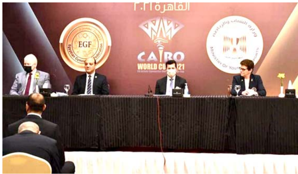
مؤتمراً، مسؤولون رياضيون خلال مؤتمر صحفي

مثل تعقيم المنشآت الرياضية يومياً، وحجز فنادق كاملة للفنادق المشاركة وتوفير اطعم طبية ملازمة للفريق المشاركة ووسائل النقل تحمي من العدوى ويرى الباحث بجامعة سنغافورة للدراسات الدولية، جيمس دورسي، أنها تحصل الدول المنظمة تكاليف إضافية، ويضيف دورسي لا يعتقد أن هدف الحكومة المصرية هو الربح اقتصادياً من هذه البطولات لأن استضافة البطولات الكبيرة لا يدر أرباحاً بل بالعكس، تكلف جداً، بينما يرى الناقد الرياضي المصري، حمدي الحسيني، أن الأموال التي دفعتها بلاده في استضافة البطولات ستجني ثمارها فيما بعد، ويتابع: "الهدف من هذه البطولات استضافة الحكومة المصرية هو استعراض النهضة الشاملة التي حدثت في البلاد أمام العالم في جميع المجالات وليس الرياضة فقط. لدى الحكومة نظرة مستقبلية، تريد جذب السياح، ليس من الضروري الآن في ظل الوباء، ولكن ربما بعد شهر أو سنة أو سنتين، وتبني الحكومة الصرية حالياً مدينة رياضية للألعاب الأولمبية، قرب العاصمة الجديدة قيد الإنشاء، يصفها المتحدث باسم وزارة الرياضة بإحدى المدن الرياضية "الأكبر في الشرق الأوسط وأفريقيا".