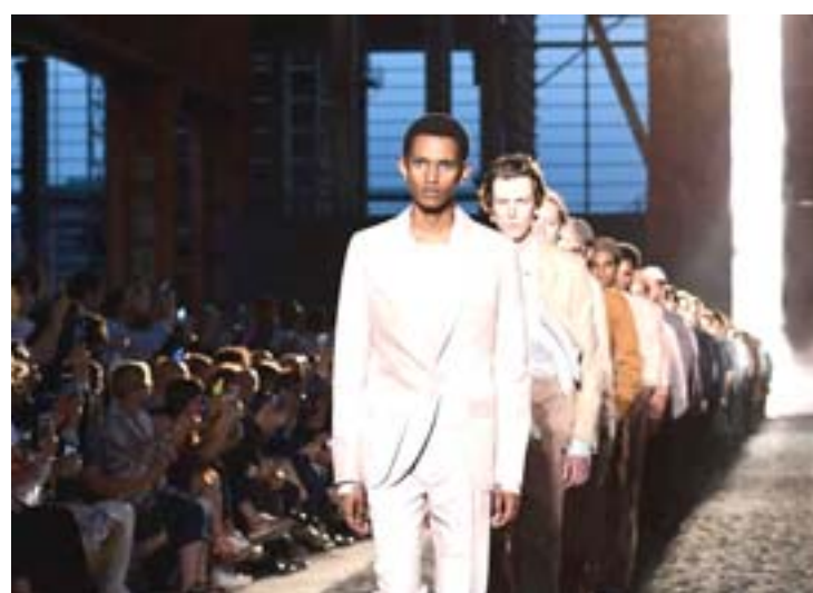
افتتحت الاسبوع الجمعة بعروض افتراضي، ظهر خلاله عارضوها تارة تارة متاهة من المساحات الخضراء وتارة اخرى وسط مباني المدينة وكانت دار ارماني في ايام الغائت اول دار ازياء ايطالية كبرى تعلن معاودة العروض