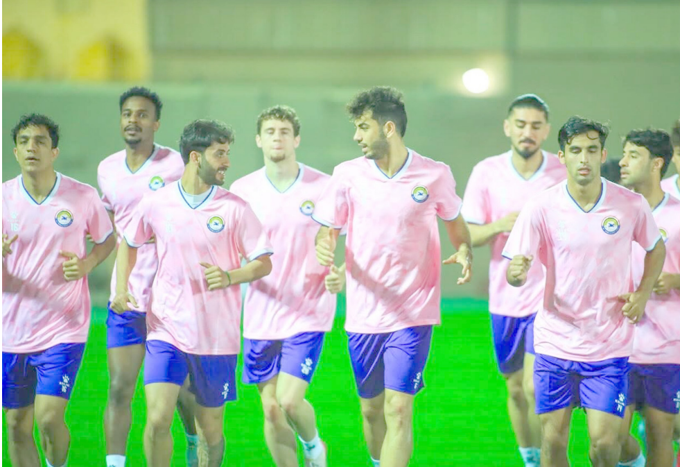
تدريبات: فريق الزوراء يجري تدريباته استعدادا لمواجهة الوصل في دوري أبطال آسيا

في اول مهمة ناجحة للمدرب ايوب اودينسيو وحقق ميسان اول فوز له تحت انظار جمهوره بهدفين لواحد على فريق القاسم . وتعادل ديبالي والكreme بهدف وقلب الكرهيااء تاخره بهدف الى فوز بهدفين على النجف . الدوري الممتاز