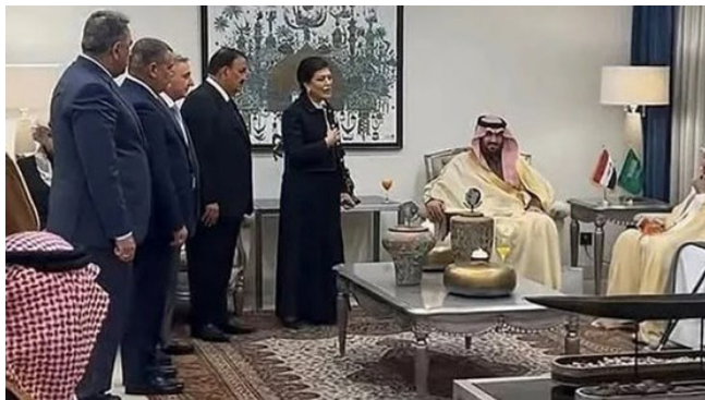
لقطة : لقطة من الفيديو المتداول تظهر بة السهيل وأعضاء الوفد العراقي

وأشار إلى أن (أهمية التزام اليهود عند اشتعال النار، فالخطوة الأولى ليست إطفاء الحريق بل فصل مصدر الحرارة باستخدام إغلاق مفتاح الغاز ثم استخدام الغطاء المعدني، وأوصى البيان (بالانتباه لحركة الأطفال والغلام من دخول المطبخ أثناء إعداد الطعام، وأهمية سرعة الاتصال بالدفاع المدني على رقم الطوارئ 911 في حالة اندلاع أي حريق).