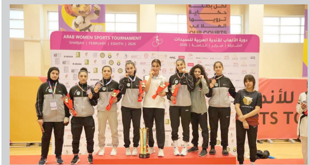
فريق: نادي غاز للشمال للتايكواندو

ويعد هذا الإنجاز محطة مهمة في مسيرة نادي غاز الشمال، ويعكس حجم العمل الفني والإداري المبذول، فضلا عن الروح القتالية العالية التي تحلت بها اللاعبات طوال منافسات البطولة.