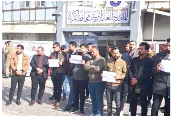
وقفة : اصحاب العقود في كربلاء خلال وقفة احتجاجية

دوامهم الرسمي لأداء رسالتهم التعليمية، ولاسيما مع بعد مدارسهم عن مناطق سكنهم، إضافة إلى حالة الإحجام التي لحقت بهم ولا يزالون يواجهونها حتى الآن)، ورفع مؤكدا إن (تاخر الرواتب المحققة (ألقأت كتب عليها انصفوا هذه الشريحة المظلومة التي تعاني التهميش).