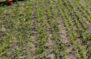
ري + محطة بستنة القائم تباشر بتشغيل منظومات الري بالرش الثابت التي تعمل بالطاقة الشمسية

الزراعي السابع عشر، بما يعكس إنجازات الوزارة في مجالات تنمية الغابات وحماية البيئة). منظومات ري من جانبها شرعت محطة بستنة القائم في محافظة الأنبار، التابعة للوزارة، بتشغيل منظومات الري بالرش الثابت العاملة بالطاقة الشمسية، بغية ري المشاريع الزراعية المنفذة ضمن تشاؤلات البرنامج الوطني لإكثار بذور محاصيل