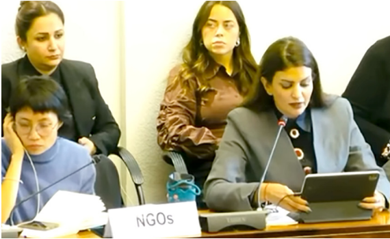
تقرير : نساء عراقيات يقدمن تقرير الظل لسيداو في جنيف

الأسري والسلم المجتمعي، حيث يحتوي القانون على أحكام فقهية قديمة تتعارض مع الدستور العراقي والنظام القانوني واستقلالية القضاء، كما تنتهك التزامات العراق (الدولية)، وأوضحت إن (الانتهاكات التي اتاحتها القانون للنساء، تشمل الزواج للصغيرات وإلغاء عقوبة الزواج خارج المحكمة وسحب حق السكنى من المطلقات وتقليص الحضانة لأمم وحرمان الزوجة من ميراث الأرض والعقار وسريان القانون بأثر رجعي دون موافقة الزوجة ومنح الزوج سلطة مطلقة في الطلاق وإجازة التعدد بدون ضوابط عادلة)، على حد تعبيرها.