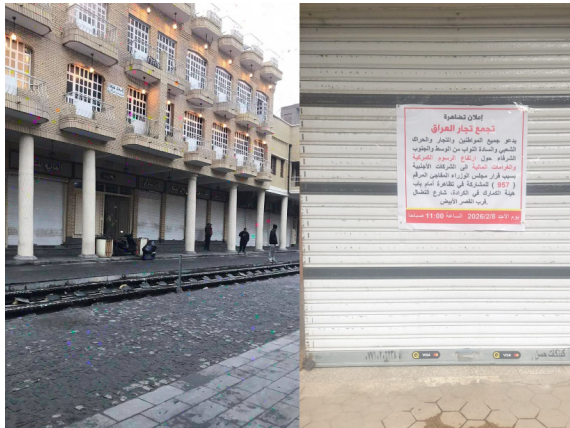
اضراب : المراكز التجارية في بغداد تغلق بسبب اضراب التجار

أعلى على السلع الكمالية التي تستهلكها الشرائح ذات الدخل المتوسط والعالي يعد توجهها بالبضائع الرديئة وتحافظ على عر الفئات الفقيرة ويحافظ على استقرار السوق وحماية السلع الأساسية). ولفت الخبراء إلى إن (العراق يطبق الاتفاقيات التجارية الدولية وفق شروطها)، وشدد الخبراء على إن (الإغراءات لا تشمل البضائع المعاد تصديرها دون قيمة مضافة حقيقية، كما نفوا وجود اتفاقيات شاملة تتيح دخول جميع البضائع بتعرفة صفرية بين الدول، مستشهدين بوجود رسوم كمركية حتى بين بعض الدول الأوروبية، فضلا عن التوجه الأميركي الأخير بغرض رسوم عالية على واردات العديد من الدول)، واستطردوا بالقول إن (تحقيق التوازن بين حماية