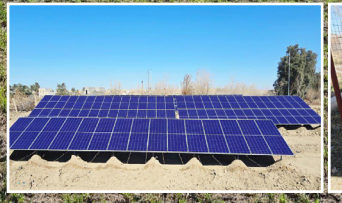
ري + محطة بستنة القائم تباشر بتشغيل منظومات الري بالرش الثابت التي تعمل بالطاقة الشمسية