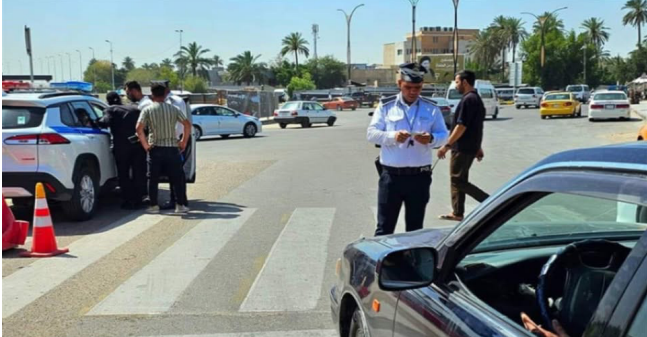
غرامة: ضابط يفرض غرامة على مركبة

الآن تسديد الغرامات المترتبة بذمتها عبر الهاتف النقال، لافتا إلى إن هذه الخدمة ستوفر على المواطنين عناء مراجعة الكابينات أو قواطع المرور، وتابع إن (الماكات الهندسية في المديرية تواصل نصب الرادارات والكاميرات الذكية في التقاطعات، وصولا إلى الطرق السريعة مثل طريق محمد القاسم وطريق القفاة)، واستطرد بالقول إن (هذه الطرق ستكون مغطاة بنقاط مراقبة على طول الخطوط السريعة داخل العاصمة بغداد، لتكون مؤمنة بالكامل وتحت المراقبة الفيديوية المستمرة).