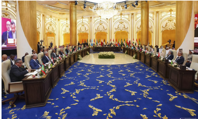
اجتماع: العراق يترأس المنتدى العربي الاستخباري في دورته السابعة

قوات سوريا الديمقراطية (قسد)، وذلك على خلفية تصاعد التوتر بين الأخيرة وقوات الحكومة السورية، وما رافق ذلك من مخاوف أمنية من احتمال هروب المعتقلين بما يهدد الاستقرار ويعرّض الأمن الإقليمي).