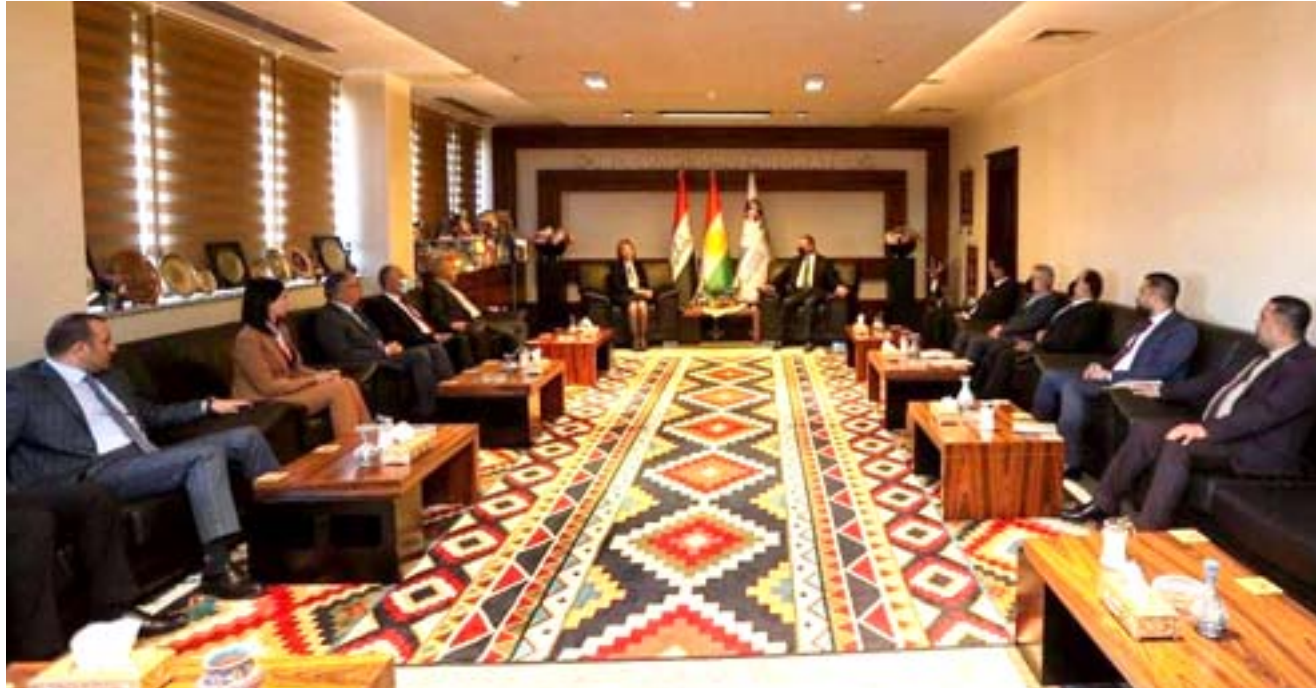
لقاء وزير الهجرة خلال لقائها المحافظ هفال ابو بكر في السليمانية

السليمانية - الزمان جددت وزيرة الهجرة والمهجرين ابفان فائق جابرو تحذيرها من محاولات بعض الجهات استغلال قاطني المخيمات سياسياً، معربة عن شكرها لمحافظ السليمانية ولقائم كردستان على تضييف النازحين منذ عام 2014 ولغاياة اليوم وتعاملهم الإنساني مع هذا الملف وقالت جابرو خلال مؤتمر مشترك عقده مع محافظ السليمانية هفال ابو بكر ان (هدف الزيارات الميدانية التي تقوم بها الوزارة هو لإنهاء ملف النزوح ضمن تنفيذ البرنامج الحكومي وكذلك العودة الطوعية لكل القاطنين في المخيمات، حيث كانت لنا زيارة إلى احد مخيمات السليمانية، ولاخطنا رغبة كبيرة من القاطنين في المخيمات بالعودة إلى مناطق سكنهم الاصلية، لهذا السبب اجتمعنا مع المحافظ لوضع خطة رصينة لتسهيل عودة الراغبين بالعودة بعد توفير وهئية الظروف الملائمة)، وأضافت ان (هناك تعاوناً كبيراً من قبل السليمانية، كما ان المحافظ يتعامل مع هذا الملف من منطلق انساني وليس سياسي، وهناك حوار مشترك بين الحكومة الاتحادية والمحافظه لحل هذا الملف وتشجيع قاطني المخيمات على العودة الكريمة لمناطقهم الاصلية)، واعربت جابرو عن شكرها (لشعب الكردى لانحسانه النازحين باعداد كبيرة