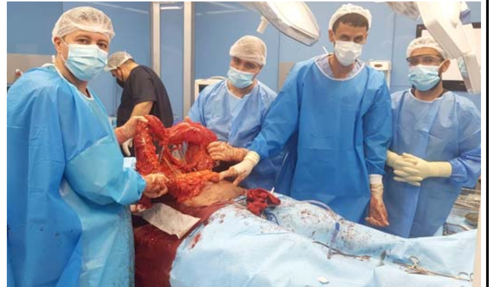
عملية: فريق طبي يجري عملية استئصال القولون لمريض في النجف

النجف - سعون الجابري نجح فريق طبي في طوارئ مدينة الصدر الطبية بجراة عملية جراحية طارئة، لرفع القولون الكامل لمریضة في السبعين من عمره. ونقل بيان لثقتة (الزمان) اسس عن الاختصاص في الجراحة الناطورية المتقدمة لأورام القولون والمستقيم في المستشفى احمد كاشف الغطاء ان (المريض كان قد راجع المستشفى وهو يعاني من إنسداد القولون الحاد نتجة