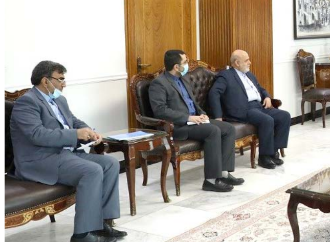
لقاء: رئيس مجلس القضاء الأعلى خلال لقائه السفير الإيراني في بغداد امس

المحافظة / قسم تجهيزات الأثاث حيث ضبطت 387جهاز تكيف في مخازن المديرية)، وأضاف ان