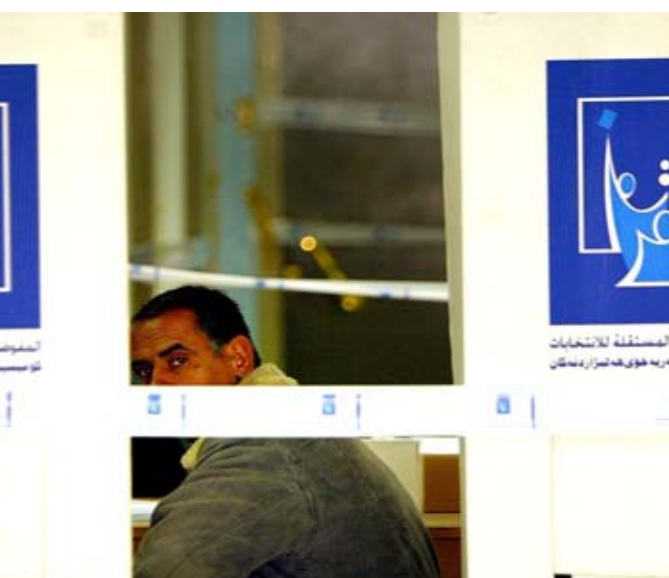
منفذ: احد منافذ مفوضية الانتخابات الخاصة بالتحديث البايومتري