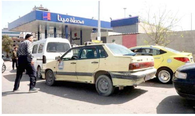
أزمة: العاصمة السورية تشهد زحاما اثر أزمة وقود

دمشق (ا ف ب) - رفعت الحكومة السورية سعر البنزين بأكثر من 90 في المئة وسط تفاقم أزمة شح المحروقات وانخفاض أسعار البنزين في الأسواق المحلية، وذلك في ظل ارتفاع أسعار النفط الخام عالمياً. ووفقاً لبيانات وزارة النفط السورية، فقد ارتفع سعر البنزين من 91.5 مليار ليرة سورية لـ 175 مليار ليرة سورية بعد ارتفاع سعر النفط الخام من 47.5 دولاراً إلى 58 دولاراً. وتعدّ هذه الارتفاعات بمثابة 54 في المئة عن السعر السابق. وتأتي الارتفاعات في أعقاب ارتفاع أسعار النفط الخام عالمياً، حيث ارتفع سعر النفط الخام من 47.5 دولاراً إلى 58 دولاراً. وتعدّ هذه الارتفاعات بمثابة 54 في المئة عن السعر السابق. وتأتي الارتفاعات في أعقاب ارتفاع أسعار النفط الخام عالمياً، حيث ارتفع سعر النفط الخام من 47.5 دولاراً إلى 58 دولاراً.