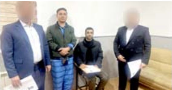
مختطف : الاجهزة الامنية تعيد مختطفا من إيران

أبي صيدا في شهر أيار الماضي، إثر خلافات سابقة بين الأطراف. وقالت الشرطة في بيان أمس إن (الحكمة أصدرت حكمها بالإعدام شققا حتى الموت وفق أحكام المادة 405 قتل تكتيدا لسيادة القانون وتحقيقاً للعدالة، وردعا لكل من تسول له نفسه المساس بامن المواطنين وسلامة المجتمع).