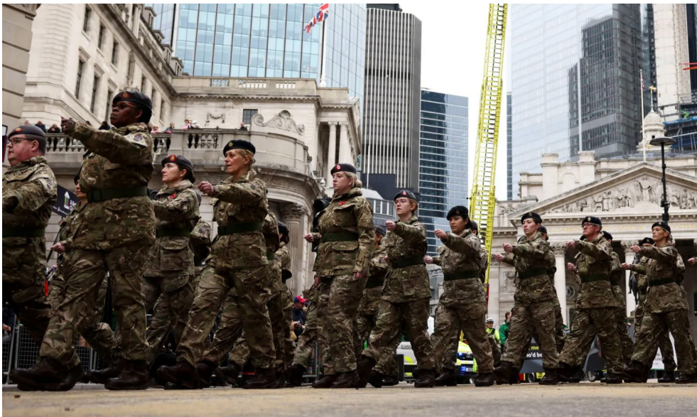
استعراض طلاب الكلية العسكرية البريطانية يشاركون في عرض عسكري بلندن

على منصة إكس أن «مشروع القانون يوسع قاعدة قوات الاحتياط (..) في ظل استمرار تزايد التهديدات العالمية. كذلك تخفف التعديلات شروط الاستعانة بجنود الاحتياط إذ تتيح استدعائهم للاستعدادات الحربية، في حين يُستلزم ذلك في الوقت الراهن وجود خطر وطني، أو حالة طوارئ كبرى، أو هجوم على المملكة المتحدة. وأشار البيان إلى أن الاستدعاء يمكن أن يشمل نحو 95 ألف شخص ضمن قوات الاحتياط الاستراتيجي. وفي كانون الأول/ديسمبر الفائت، رُكِبَ أركان القوات المسلحة البريطانية بإصدار نايبون إلى أن أبناء 2027. ولن تلام هذه التعديلات من يكونوا سبق لهم ترك الخدمة العسكرية إلا إذا اختاروا الانحساق طوعا بخدمة. وأوضحت وزارة الدفاع