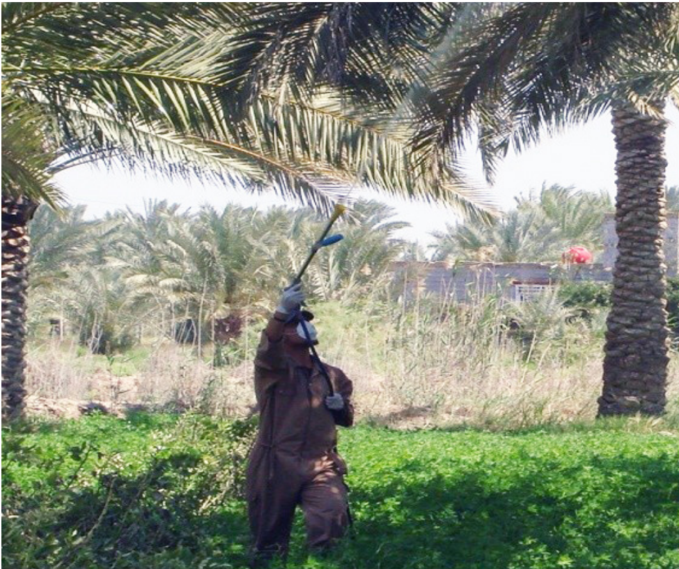
مكافحة : دائرة وقاية المزروعات ترش المبيدات على أشجار النخيل

مؤكدين أن مسؤولية الحفاظ على البيئة لا تقع على الأفراد فحسب، بل على المؤسسات الحكومية المعنية بالتشريع والرقابة والتفقيذ. كما أشارت مصادر شيعية من المختصين واصحاب السباتين الى شخ في مواد مكافحة وتأخير في تجهيز تلك المواد من قبل الجهات ذات العلاقة، فيما عبر الفلاحون عن سخطهم من لجوئهم الى الأسواق لشراء المواد الوقائية