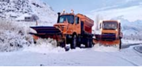
تلوج : اليات تجرف ثلوجاً متراكمة في حاج عمران

رَجَحَ متنبىء جوي، تأثر أجواء البلاد بحالة جوية جديدة ابتداء من يوم غد الأحد، مع عودة الارتفاع التدريجي لدرجات الحرارة خلال الأسبوع الجاري. وكتب المتنبى صادق عطية في صفحته على فيسبوك أمس إن (حالة جوية جديدة ابتداء من يوم غد الأحد تؤثر في مناطق شمال البلاد ويضع مدن الوسط مع عودة الارتفاع التدريجي لدرجات الحرارة خلال الأسبوع الجاري)، وشدد على القول إن (الأجواء تشهد استقراراً نسبياً اليوم السبت)، فيما توقعته الهيئة العامة للأنواء الجوية، تساقط للأمطار وتبايناً في درجات الحرارة، وقال بيان للهيئة تلتته (الزمن) أمس إن (طقس اليوم السبت سيكون غائماً جزئياً في المنطقتين الوسطى والجنوبية،