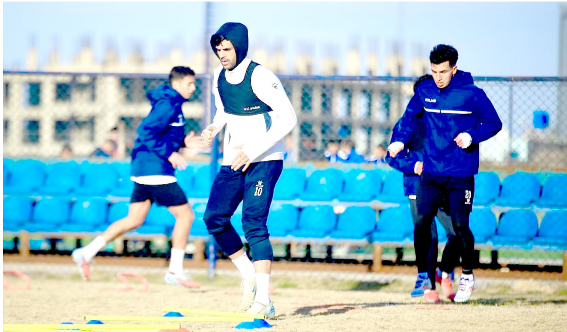
تدريبات فريق القوة الجوية يواصل تدريباته استعدادا لمواجهة دوري المحترفين