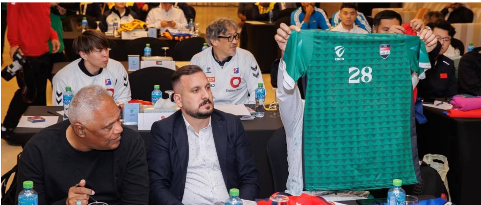
مباراة : المؤتمر الفني الذي يسبق مباراة العراق والصين بكرة اليد