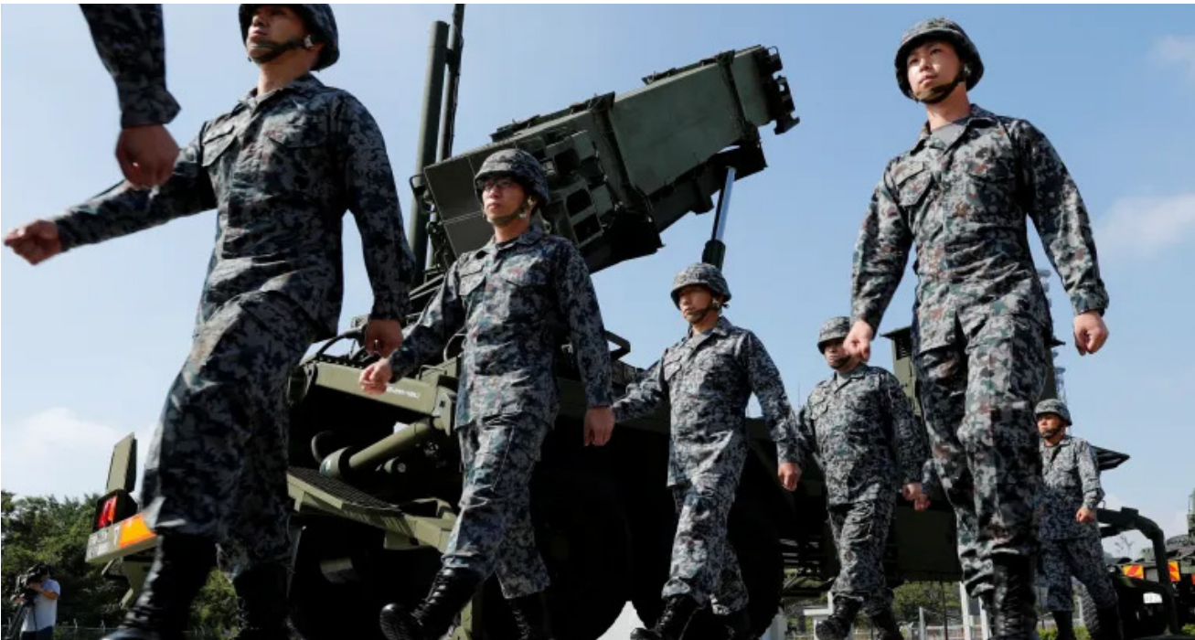
منظومة جنود يابانيون الى جانب منظومة صواريخ يابانية متطورة

وكان الرئيس التايواني لاي تشينغ-تي تعهد بزيادة الاستثمارات في الولايات المتحدة ورفع الإنفاق الدفاعي، في إطار مساعي حكومته لخفض الرسوم الأميركية وتجنب تأخيرها على صادرات الرقائق الإلكترونية التايوانية. وأوضحت الوزارة أن الشركات التايوانية التي تبني منشآت جديدة لإنتاج الرقائق في الولايات المتحدة ستحصل أيضا على معاملة أكثر تفضيلا في أي رسوم مستقبلية قد تفرض على أشباه الموصلات. ورحب رئيس وزراء تاوان تشو جونغ-تاي الجمعة بالاتفاق وقال إن «هذه النتائج تؤكد أن التقدم الذي أحرز قد تحقق بشق الأنفس».