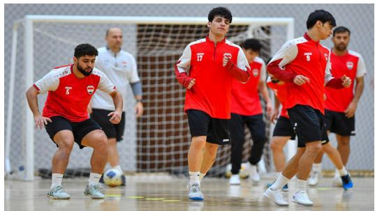
تدريب : وحدة تدريبية لمنتخب الصالات في الكويت

أخير يستمر بضعة أيام قبل الدخول في بطولة كأس آسيا. وأضاف، أن منتخبنا الوطني سيخوض مواجهة ودية أمام منتخب ماليزيا في إندونيسيا في ختام استعدادات المنتخبين للبطولة الآسيوية. وأشار إلى أن الجهاز الفني الذي يقوده البرازيلي جواو كارلوس باربوسا، استفاد من تجمع اللاعبين وطور الجوانب الفنية والبدنية ووضع خطته قبل دخول المنافسات الرسمية، مبينا أنه اكتفى بمعسكر الكويت بعد خوض منتخبنا مباراتين وبيتين أمام الكويت، تعادل في الأولى 2-2 وفاز في الثانية 3-1. وأوقعت القرعة منتخب العراق في المجموعة الأولى إلى جانب منتخبات إندونيسيا، وقرغيزستان، وكوريا الجنوبية.