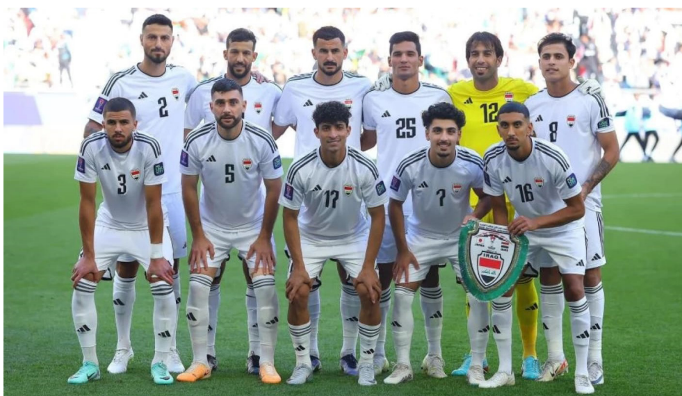
المنتخب الوطني لكرة القدم

المباراة النهائية في نيويورك، وبمباراة الافتتاح في مكسيكو سيتي. ووصف جيباني إنفانتينو، رئيس فيفا، هذا الإقبال بأنه أكبر من مجرد طلب، إنه تصريح عالمي موجاه لشركه للجماهير ومؤكدا التزام الاتحاد بتوفير تجارب بديلة لن إن يحافظ الحظ في دخول الملاعب. ومن المقرر إخطار المشجعين بنتيجة طلباتهم عبر البريد الإلكتروني بحلول الخامس من كانون الثاني 2026، حيث سيتم تحصيل الرسوم تلقائيا للطلبات الناجحة، مع منح فرصة أخرى للاسرين في مرحلة "مبيعات اللحظة الأخيرة". وأكد فيفا أن تذكرة المباراة لا تضمن دخول الدول المضيفة للمونديال، داعيا الجماهير للبدء في إجراءات التأشيرة فوراً نظرا لتعقيد المتطلبات كما أشار البيان إلى أن 90%من طلبات الإبرادات سنفاد استثمارها في تطوير اللعبة عالمياً. الافتتاح العشوائي التي استمرت 33 يوما فقط. وبحسب الموقع الرسمي لفيفا، فإن هذا الرقم لا يمثل مجرد طلبات شراء، بل هو بيان عالمي يعكس الشغف غير المسبوق بالنسخة الأولى التي تضم 48 منتخبا. وسجلت هذه المرحلة معدلاً مذهلاً بلغ 15 مليون طلب يوميا، حيث جاءت الطلبات من كافة الدول والأقاليم التابعة لـ 211 اتحادا عضوا في فيفا. وتصدرت الولايات المتحدة والمكسيك وكندا الدول الميابة قائمة الدول الأكثر طلبا، تلتها ألمانيا وإنجلترا والبرازيل وإسبانيا والبرتغال والأرجنتين وكولومبيا. والمفاجأة الكبرى كانت في المباراة الأكثر طلبا، حيث تصدرت مواجهة كولومبيا ضد البرينتلز المقرر إقامتها في ميامي يوم 27 يونيو قائمة الرغبات، متفوقة حتى على