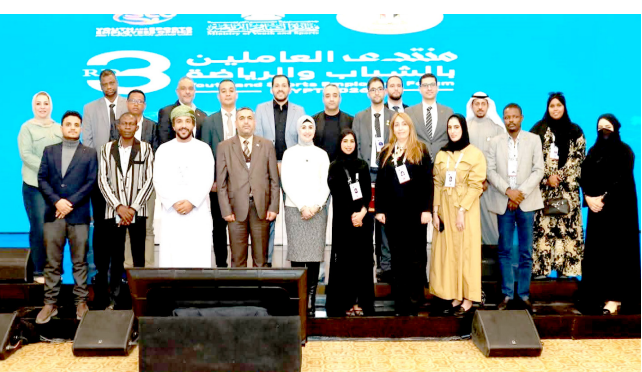
لقطة لممثلي وزارات الشباب العربية في مصر

وفي الجلسة الختامية للمنتدى، تلا الدكتور البياتي التوصيات الختامية ممثلاً عن الدول المشاركة، أمام السادة وزراء العرب وممثلي