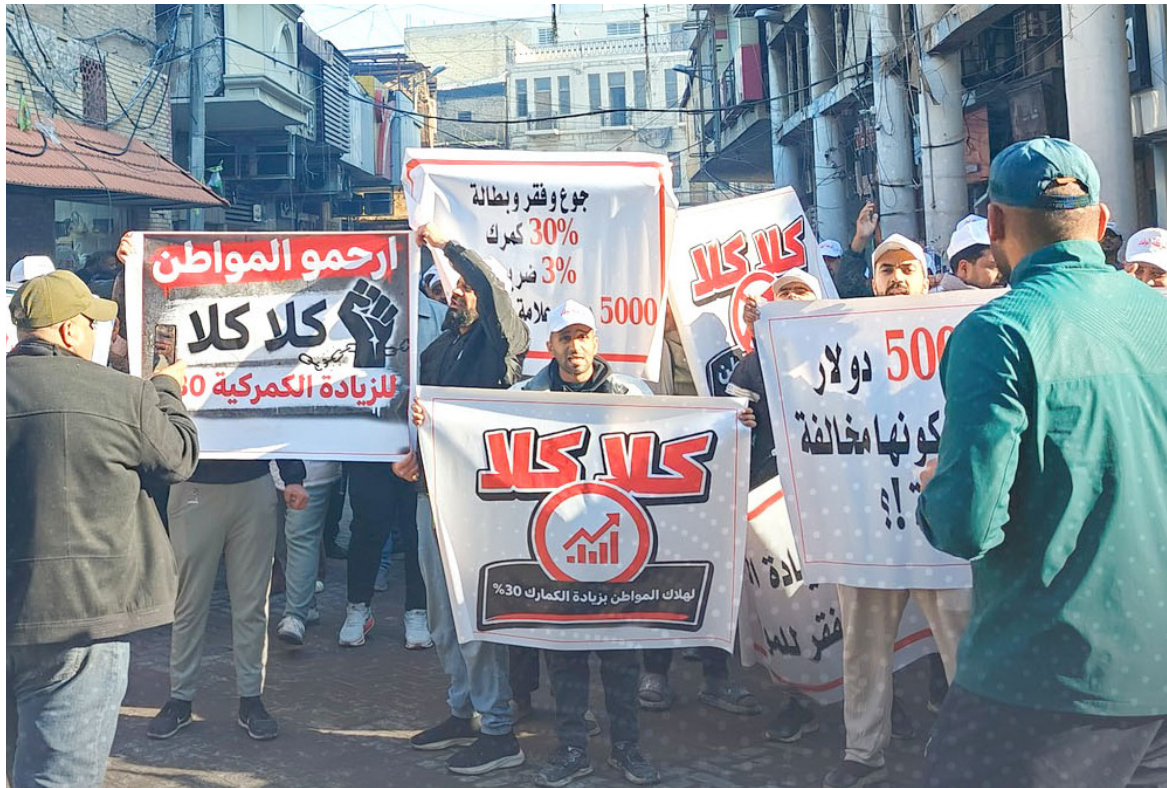
تظاهرة : تاجر وكسبة يتظاهرون أمام غرفة تجارة بغداد

بغداد - قصي منذر تظاهر التجار والمستوردين وصناعة الذهب، أمام غرفة تجارة بغداد، احتجاجاً على فرض التعرف الكمركية الجديدة. وقال المتظاهرون أمس إن (إجراءات التعرف الكمركية، إلى جانب متطلبات الديان المتطلبات وشهادة المنشأ أثناء الاستيراد، تعقّد الحركة التجارية بشكل كبير)، محذرين من إن (استمرار هذه الإجراءات سيؤدي إلى ارتفاع أسعار المواد والسلع الأساسية في الأسواق المحلية). فيما تناولت مواقع التواصل الاجتماعي، النصار الوطني الشيعي