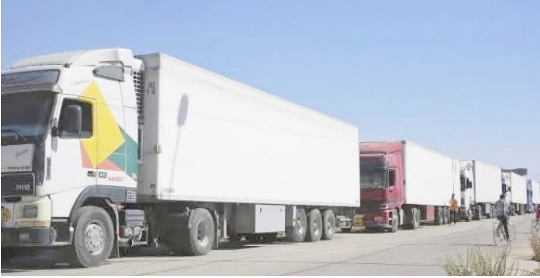
كمارك: شاحنات تصطف عند مركز للكمارك

بغداد - قصي منذر نفث الهيئة العامة للكمارك، حدوث زيادة في الرسوم المفروضة على المواد الغذائية والأدوية والسلع الأساسية، موضحة أن التغييرات الأخيرة اقتصرت على البية الاحتساب والإجراءات الإدارية. وفق نظام الكتروني معتمد عالميا، وليس رسوم جديدة. وقال المدير العام للهيئة، ثامر قاسم، في تصريح امس ان (قرار مجلس الوزراء رقم 957 للعام الجاري. جاء تطبيقا لقانون التعرفة الكمركية رقم 22 ، الذي لم يُنفذ بسبب ضعف البنى التحتية. وعدم اكتمال الامتنة في المراكز الكمركية). مشيرا إلى ان (اكتمال تطبيق نظام الاسيسكو الالكتروني اتاح تنفيذ القانون بالشكل الصحيح). وأضاف قاسم ان (القانون لا يتضمن زيادات كبيرة في الرسوم،