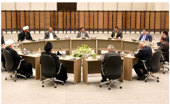
اجتماع : قادة الاطار التنسيقي خلال اجتماعهم اول امس

الاجتماعه الدوري في مكتب محسن المندلاوي، لمواصلة بحث ملف تشكيل الحكومة المقبلة وحسم تسمية رئيس مجلس الوزراء، في إطار الاستحقاقات الدستورية للمرحلة القادمة، مشيراً إلى إن (الاجتماع شهد أجواءً إيجابية ونقاشات مسؤولة، أسفرت عن تطورات مهمة ومؤشرات متقدمة، بما ينسجم مع متطلبات الاستقرار السياسي والمصلحة العليا للبلاد). وكانت وسائل إعلامية ومواقع التواصل الاجتماعي قد تداولت على نطاق واسع أنباء تفيد بتوصل قوى التنسيقي في اجتماع سابق إلى توافق على ترشيح المالكي، لشغل منصب رئاسة الحكومة المقبلة، وهو ما لم يتطرق إليه البيان الرسمي. وأفاد مصدر أمس إن (رئيس الحكومة متنتهية الأولية محمد شياع السوداني، قرر سحب ترشيحه لولاية ثانية في المنصب لصالح المالكي)، وأضاف إن (التنسيقي ما يزال يبحث حسم ترشيح المالكي بشكل رسمي حتى الآن). في نفس رئيس مجلس النواب هيثم الحبوسي، جهوداً كما ناقش الحبوسي، مع رئيس مجلس القضاء الأعلى