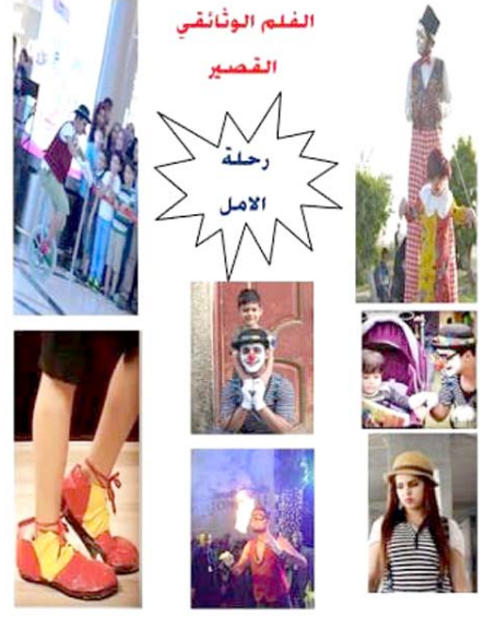
الفيلم الوثائقي القصير رحلة الامل

تفاصيل الفيلم قائلا (رحلة امل فيلم وثائقي قصير مدته لايتجاوز دقيقتين وهو رسالة محبة وسلام لاطفال العراق واقول من خلاله كفي حروبا وتشريدا وضياعا والفيلم تم تصويره بعدة مناطق في العاصمة بغداد وكل محطة يتم تصويرها هي بمثابة مشهد مثلا حسناق ابي نواس والمسرح الوطني وتوجد مشاهد والعباب وبهلوانية والعباب ناربة ويتم نقل الاطفال المشاركين بالفيلم من مكان الى اخر وتقديم الهدايا والاعباب لهم وخاصة الذين فقدوا نوبهم وقدمنا عروضنا استعراضية ومشاهد تجسد اعادة الحياة الى الطفولة) . والمخرج اختصه موسيقى لكن سرعان ماتحول الى الإخراج التلفزيوني وعن تحوله هذا قال (حبيبتني الكاميرا مع الناس ولم