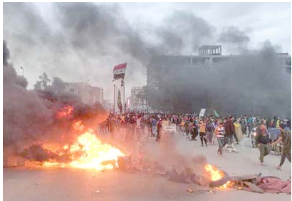
اشتباكات: تجدد الاشتباكات في مدينة الناصرية ووقوع ضحايا

واندت بعثة الأمم المتحدة في العراق بشدة العنف القاتل في ذي قار. ودعت البعثة في بيان تلقته (الزمان) أمن السلطات إلى وضع حد للافلات من العقاب، مشدداً على (ضرورة تقديم أولئك المسؤولين عن هذا والهجمات السابقة للعادلة)، وأشار إلى أن (الحل السلمي للخلافات هو الطريق الوحيد للمضي قدماً).