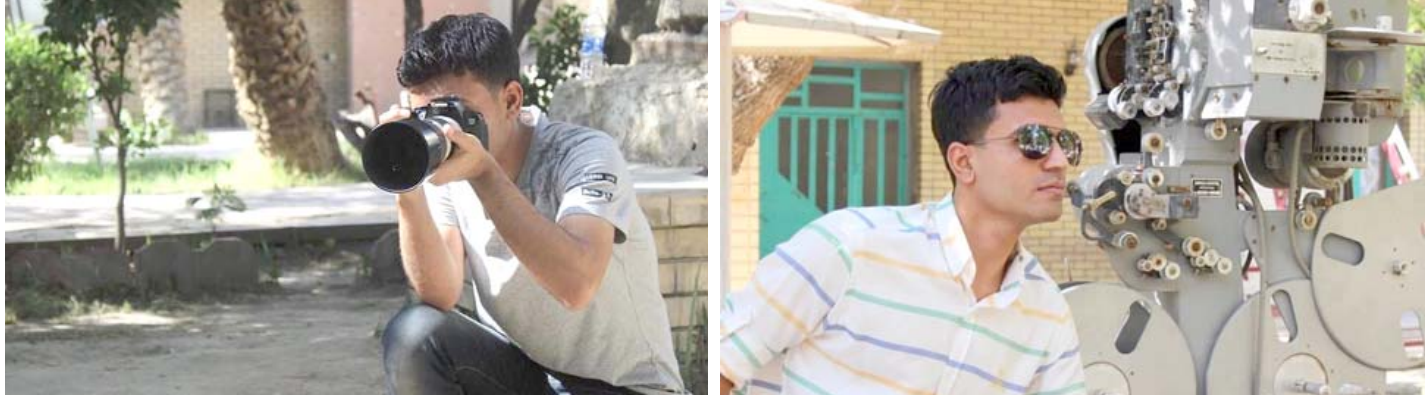
المخرج ليث القره لوسي خلال اجازته الفيلم

رأسي ، كوني ميالا للسينما الواقعية باحثا عن القصص من حولي والتي تحتاج لحل من خلال اندماحي مع الناس بمنطق عيشهم وان متقدمه الان هو مجرد صناعة فيلم ) مؤكدا ان (كل فيلم انجزه يكسبني خبرة في كل تفاصيل الفيلم) . (ورحلة امل) عن تمثيل حسين حامد