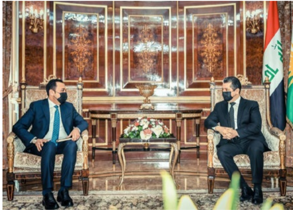
استقبال : رئيس حكومة إقليم كردستان خلال استقباله محافظ أربيل الجديد

يتزمت الهيئتي أنياً لأرائه ، لكنه يترجع عن الخطيء منها عندما يشبعها دراسة وتأملاً ، لذلك لم أستغرب تراجعه واجعله اعتراف بصحة رأيي ، فازدادت صورته بريفاً في عظمي ، وأنا المقتون به بالأصل ، في لغة الهيئتي ومضامينه بريق يستدعيك لغزاة منجزه أكثر من مرة من دون ملل . أما الكتاب الآخر الذي تشبهوني كتاباته ، فأتك الحديث عنه لقدام من المقالات .