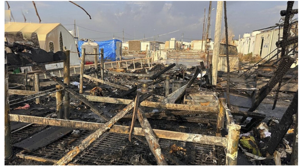
حريق : أثار الدمار الذي طال المخيمات نتيجة الحريق