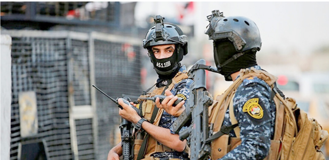
أمن : أجهزة امنية تقوم بعملها في بغداد

التي تقوم بتنفيذها قسم هندسة النفط في الهيئة، حيث تهدف هذه البرامج إلى متابعة ودراسة سلوك الضغط المكنني عبر إعداد خرائط توزيع الضغط والسلك للمكامن النفطية، والخرج بالاستنتاجات والتوصيات الفنية اللازمة وإعداد الخطط السنوية لإنتاج النفط والغاز ورفعها إلى الجهات العليا في الوزارة، فضلا عن مراجعة الدراسات الفنية التي يعدها فريق الدعم الفني التابع للمشغلين (بتروجان، سينوك، وديمة، وإبداء الملاحظات الفنية بشأنها، والمشاركة في اللجان الفنية المشتركة مع المشغلين واللجان التخصصية داخل الشركة، إلى جانب إعداد العرض التقديمي الخاصة بسلوك المكامن