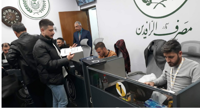
خدمات : مصرف الرافدين يقدم خدمات للزبائن

بغداد - الزمان استعاد مصرف الرافدين أكثر من 15 مليار دينار من المقرضين المتلكئين في تسديد المستحقات المالية التي يذمتهم خلال شهر واحد، فيما نبه المتلكئين في مجمع سيمائية إلى ضرورة تسديد الأقساط التي يذمتهم قبل اتخاذ الإجراءات القانونية بحقهم. تفصيلاً أدارات وأكد المكتب الإعلامي للمصرف في بيان أمس أن الجهود التحصيلية المكثفة التي تنفذها الإدارات والفروع ضمن خطة العمل المعتمدة أسفرت عن استعادة 15 مليار و 516 مليون دينار عراقى من الديون المتراكمة، مبيناً أن المصرف يواصل تنفيذ حملات التحصيل والمتابعة الميدانية والإدارية بوتيرة تصاعدية لضمان حماية أموال المصرف وتعزيز الانضباط المالي. ودعا المصرف جميع المتلكئين إلى مراجعة فروعهم في بغداد والمحافظات لإكمال إجراءات التسوية المالية وتحديد مواقعهم الائتمانية، مؤكداً في الوقت نفسه استمرار اتخاذ الإجراءات القانونية والتنظيمية بحق الممتنعين عن السداد، بما في ذلك تطبيق قانون استصدار أحوال الدولة وفرض الغرامات التأخيرية المنصوص عليها. ويأتي هذا الإنجاز ضمن سياسة المصرف الرامية إلى تعزيز ثقافة إدارة الديون، وتطوير الانضباط الائتماني، وضمان استدامة السيولة وجودة الخدمات المصرفية المقدمة للمواطنين. الى ذلك دعا المصرف المقرضين المتلكئين في تسديد أقساط قروض جميع بسمائة السكنى إلى الإسراع بمراجعة الفروع المختصة لتسديد المبالغ المستحقة يذمتهم وفاء بالتزاماتهم التعاقدية وحفاظاً على المال العام.وأكد المصرف أن التزام المقرضين بالسداد يمثل استحقاق قانوني، وساهمة مباشرة في إعادة تدوير واستثمار هذه الأموال لتحويل وحدات سكنية جديدة بما يتبع لعدد أكبر من المواطنين فرصة الحصول على سكن في المشروع.