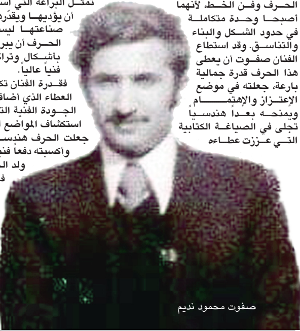
صفوت محمود نديم

السليمانية - احمد سعيد من الصعب أن أتحدث عن الفنان والخطاط الراحل صفوت محمود نديم بعيداً عن الحرف وفن الخط، لأنهما أصبحا وحدة متكاملة في حدود الشكل والنماء والتناسق. وقد استطاع الفنان صفوت أن يعطي هذا الحرف قدرة جمالية بارعة، جعلته في موضع الإعتراف والإهتمام ويمنحه بعداً هندسياً تجلّى في الصياغة الكتابية التي عززت عطائه