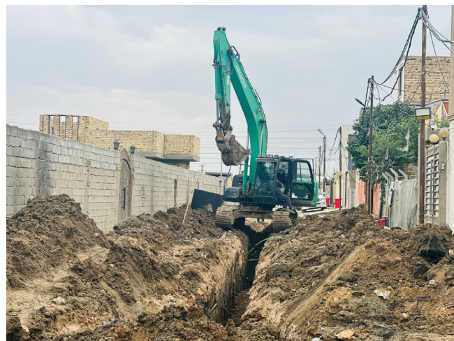
حفز : الية تقوم بحفر الأرض تمهيدا لمد انابيب المجاري

المحافظات - مراسلو (الزمان) تواصل ملاكات محافظة بغداد. مشاريع تطوير شبكات تصريف المياه ضمن الجهود الحكومية الرامية إلى