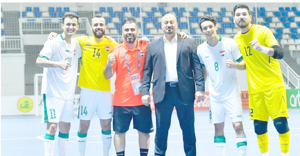
صالات: المنتخب الوطني لكرة الصالات

بغداد- الزمان أعلن الجهاز الفني لمنتخب العراق الوطني لكرة الصالات، بقيادة المدرب البرازيلي جواو كارلوس باربوسيا، برنامج المباريات الودية المقبلة ضمن إطار التحضيرات المكثفة لنهائيات كأس آسيا لكرة الصالات، التي ستقام في اندونيسيا نهاية الشهر الحالي. وسيخوض منتخب العراق