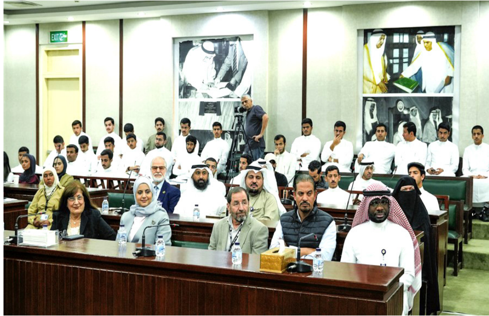
حضور : جانب من الحضور في مؤتمر اللغة بكلية القانون الكويتية

تتفق نظرية ولفتت إلى (تتفق هذه النظرية على بعض الطروحات السائدة العالمية، وارتباطها بجهود تراثية عربية عميقة في فهم النظام اللغوي). ويتزامن الحراك الأكاديمي مع إعلان منظمة الأمم المتحدة اليونسكو، شعار اليوم العالمي للغة العربية 2025، (الذي جاء بعنوان مسارات مبتكرة للغة العربية سياسات