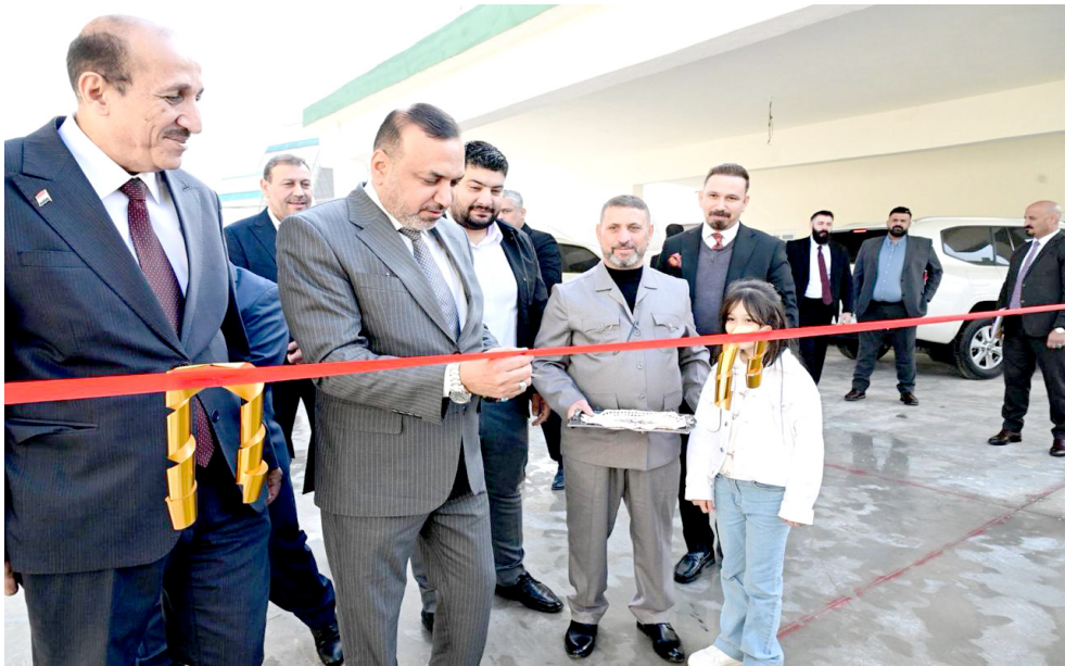
افتتاح : وزير العمل يفتتح مبنى مركز تكنولوجيا المعلومات

كما افتتح الأسدي، مبنى جديد لصندوق هيئة الحماية الاجتماعية. وأوضح الأسدي إن (إنشاء بناية