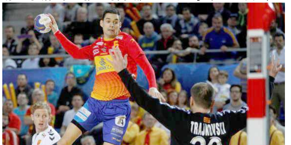
صدارة: منتخب إسبانيا بكره اليد يتصدر المنتخبات للعبة

مديره وكالات: كان ميلان وانتر، أكثر المتضررين من المرحلة السابقة من الدوري الإيطالي، في الوقت الذي اقترب فيه المنافسون من صدارة ترتيب المسابقة. وخسر ميلان أمام يوفنتوس حامل اللقب 3-1 وهي الهزيمة التي انتهت سلسلة وصلت إلى 27 مباراة دون خسارة لميلان، وسيكون الفريق غدا السبت على موعد مع اختبار مهم أمام تورينو العنيد رغم معاناته في هذا الموسم. وسيواجه ميلان، تورينو مرة أخرى يوم الثلاثاء في كأس إيطاليا، والتي تتضمن أيضاً 6 أندية من السبعة الأوائل في ترتيب الدوري. وتعرض إنتر للخسارة 1-2 أمام سامبدوريا، ليبقى خلف ميلان المتصدر بفارق نقطة وحيدة، كما أن الخسارة منعتهم من تحقيق الفوز الثامن على التوالي، وسيواجه روما صاحب المركز الثالث بعد غد الأحد، والذي يمكنه معادلة رصيد إنتر، في حال تمكن من التغلب عليه. ويتواجد يوفنتوس خلف روما بفارق 3 نقاط، وذلك قبل ان يواجه يوم الأحد ساسولو صاحب المركز الخامس، والذي