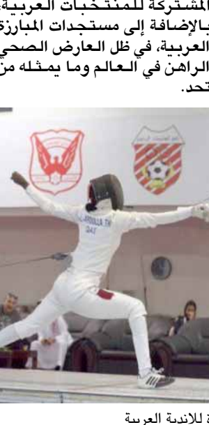
أحدى مباراة المبارزة للأندية العربية

□ دبي- الزمان ناقش المكتب التنفيذي للاتحاد العربي للمبارزة، خطط وبرامج الاتحاد في موسم 2020-2021 واعتمد إستراتيجية جديدة للبطولات والتجمعات العربية. كما تبني العديد من المباريات المهمة التي تحدم المبارزة العربية، ومن أهمها استحداث بطولة كأس العرب للعمومي للأندية الفردية والفرق، واقتصاص بطولات المنتخبات العربية للفتات العربية تحت الـ 17 و الـ 13 و الـ 10 سنة. وجاء ذلك في اجتماع المكتب التنفيذي الذي عقد عن بعد بتقنية الاتصال المرئي، وترأسه المهندس الشيخ سالم بن سلطان القاسمي، رئيس الاتحادين العربي والإماراتي للمبارزة. وتطرق الاجتماع إلى العديد من الموضوعات المدرجة على جدول