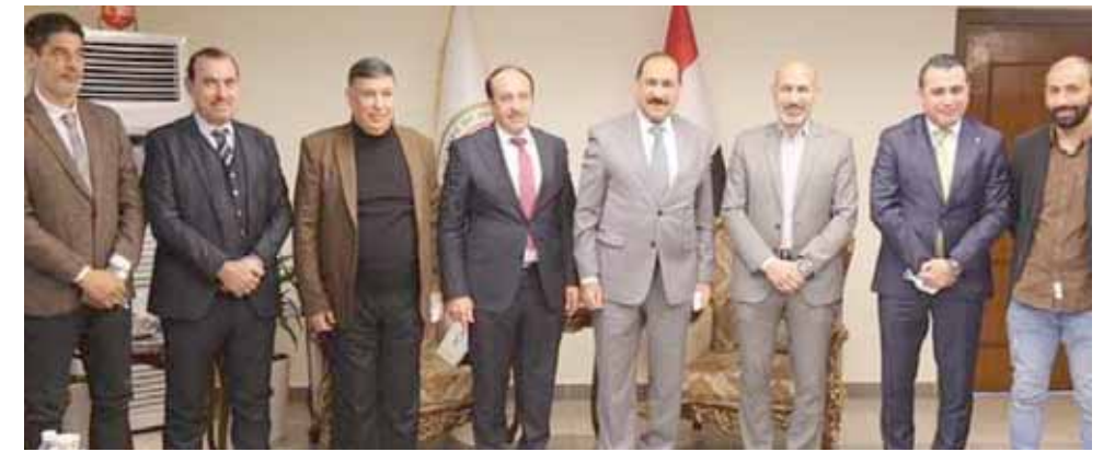
لقاء: وزير النقل لقاته الهيئة الادارية لنادي الزوراء

الشبلي، استقبل اليوم الهيئة الادارية لنادي الزوراء والكاثر التدريبي الجديد في مقر