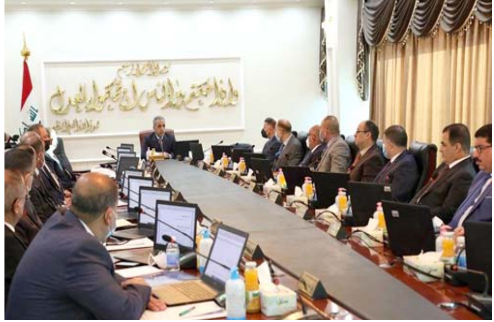
جلسة : جانب من جلسة مجلس القضاة الأعلى برئاسة فائق زيدان

بحقه إلا بموجب قرار قضائي ، لذا فإن القضاء كان ولا يزال العكس هو الصحيح وأن هذا الإجراء هو بمثابة تعليق الإخفاق في أداء السوابج على عاتق القضاة ليشير البعض أمام الرأي العام أنه أدى واجبه والقضاء هو المتسبب في عدم تحقيق النتائج المرجوة وهذا لا يتسجم مع التوجه الصحيح في بناء دولة يحترم فيها القانون).