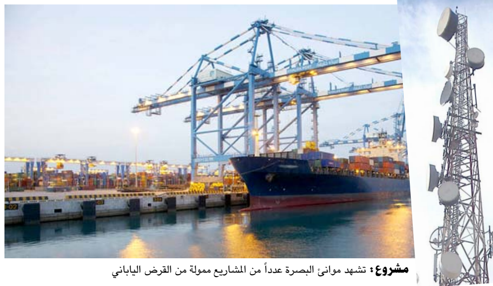
مشروع : تشهد موانئ البصرة عدداً من المشاريع مموله من القرض الياباني

اشراف وتمويل هذا القرض) ، وتابع ان (ذلك يعد قاعدة صناعية كبيرة جدا لرصيف الشركة ويتضمن بني تحتية تسهم بالحفاظ على المعدات البحرية). واذف انه (تم تنظيم برنامج خاص مع اربع شركات للتحويل والمحافظة).