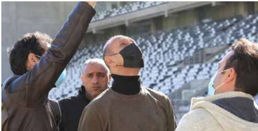
زيارة: وزير الشباب خلال زيارة الى محافظة البصرة والاطلاع على المدينة الرياضية

وزير الشباب والريضة عدنان درجال، ان العراق اليوم والبصرة تحديداً جاهزة لاستضافة الأشقاء الطلبة الكروي ويساعده كل من بهاء كاظم وحيدر محمد ابو عجة ومدرب الحراس سعد ناصر. واضافت ان ادارة نادي الطلبة قررت توجيه العقوبة بحق عدد من لاعبي الفريق بسبب النتائج السلبية.