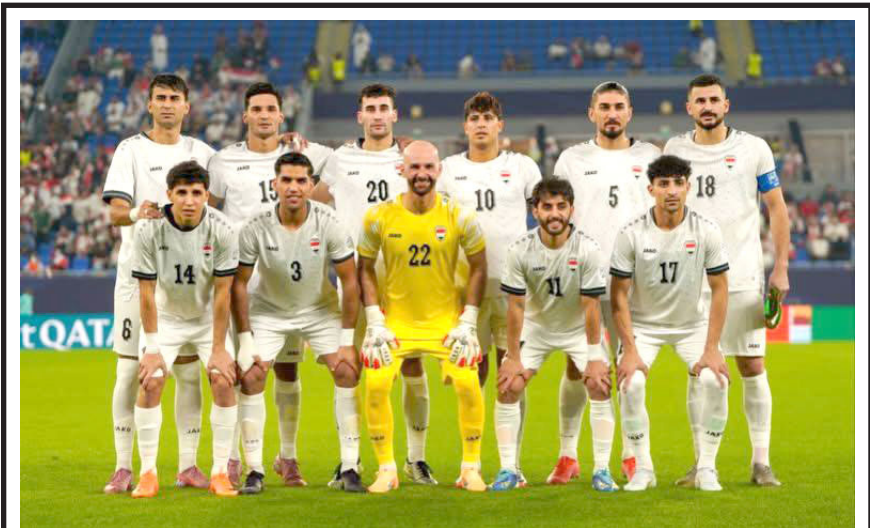
مباراة: جرت أمس مباراة بين المنتخب الوطني العراقي ونظيره السوداني ضمن مواجهات بطولة كأس العرب. نتيجة اللقاء على الموقع الإلكتروني لجريدة (الزمان).

بريار رفيق في تصريح أمس إن (مجموع ما تم نهبه أو تهريبه وصندوق النقد)، وأضاف إن (هذه التقديرات تقوم على بيانات متقاطعة من مصارف دولية وسجلات تجويلات مالية)، وتابع إن (جزءاً واسعاً من هذه الأموال جرى تهريبها إلى الخارج، وتقدر بنحو 520