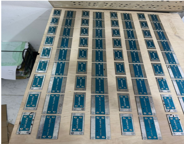
اختتام :مجموعة من الاختتام المزورة المضبوطة في منفذ طريبيل