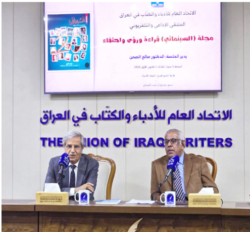
احتفاء: لقطات من احتفاء الملتقى الاداعي والتلفزيوني باسرة مجلة (السينمائي)