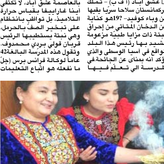
بريطانيا تحذر: كورونا يجب الإحتشاد