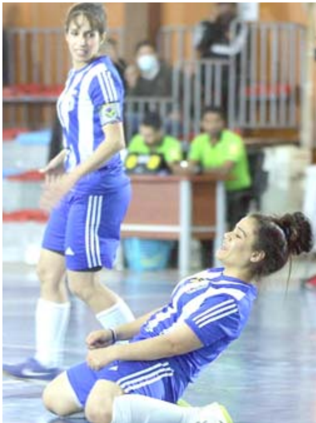
أحدى مباريات كرة الصالات

بغداد- الزمان انطلقت مباريات دوري كرة الصالات النسوي للموسم 2020-21 على قاعة المرأة في مجمع 2012 وزارة الشباب، حيث قفز شريط افتتاح مباريات الموسم فريقا القوة الجوية وبلادي، وانتهت بفوز الاول بعشرة اهداف من دون مقابل. وشهدت مباراة الافتتاح حضور وزير الشباب والرياضة، عدنان درجال، والسائق علاء الدلفي، ورئيس الهيئة التطبيقية ايداد بنينان، و اسعد لازم، و راشد عبد الامير، والامين العام للطبيعية محمد فرحان، فضلا عن حضور رئيس واعضاء اللجنة النسوية. أحداث المباراة اشترت تفوقا واضحا وسيطرة مطلقة لاعبات القوة الجوية، حيث تمكن من انزال هزيمة قاسية بفريق بلادي بنتيجة (10-0)، وكان الشوط الاول قد انتهى (6-0). وفي سياق متصل افتتح فريقا نطق الشمال وشباب المستقبل منافسات دوري الكرة النسوي للملاعب المشقوفة للموسم 2020-21، واقيمت المباراة على ملعب 2021 الشعب الثاني، وانتهت بفوز نطق الشمال على شباب المستقبل بخمسة اهداف من دون مقابل. واستطاع فريق نطق الشمال من السيطرة على مجريات المباراة، وإحراز الاهداف الخمسة.