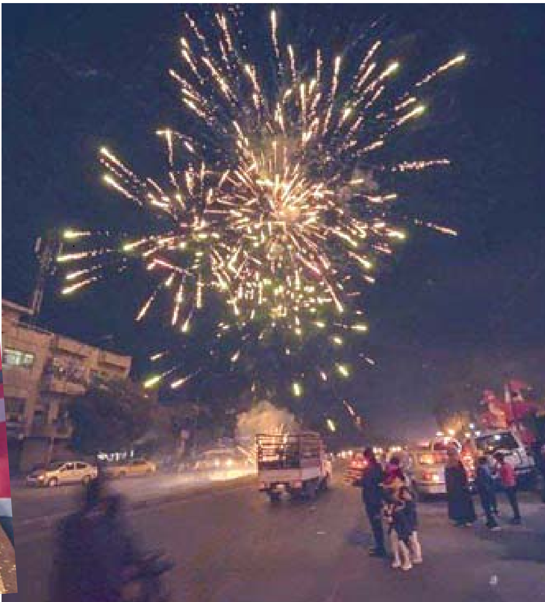
بغداد - الزمن

شهدت ساحة التحرير وشوارع بغداد مساء الخميس احتفال المواطنين بقدوم عام وتوديع عام، بولهم أمل ان يكون 2021 افضل من سابقه وان يتم القضاء على جائحة كورونا، واستمر اطلاق المواطنين للالعاب النارية حتى الساعات الاولى من فجر امس الجمعة.