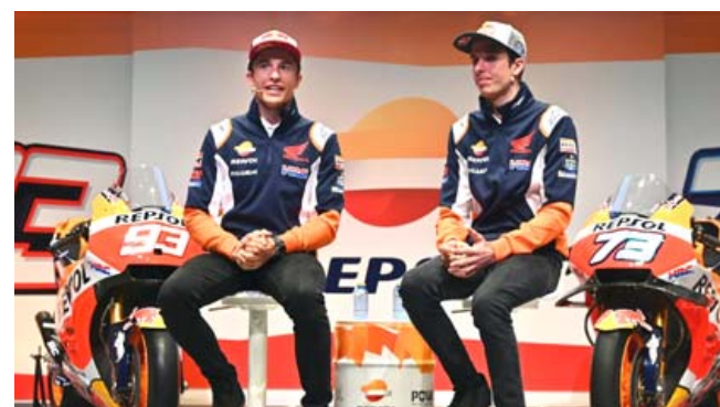
بطل العالم للدراجات النارية مارك ماركيز

مدن - وكالات: أعلن فريق هوندا يوم الثلاثاء أن بطل العالم للدراجات النارية مارك ماركيز يمكنه أن يعود للسباقات الشهر المقبل بعد الخضوع لجراحة ناجحة في زراعته الأيمن. وأصيب ماركيز خلال حادث قبل أربع لفات على النهاية في السباق الافتتاحي للموسم بجائزته إسبانيا الكبرى في خريف يوم الأحد. وخضع بطل العالم ست مرات لجراحة في برشلونة وتبدو فرصة كبيرة في