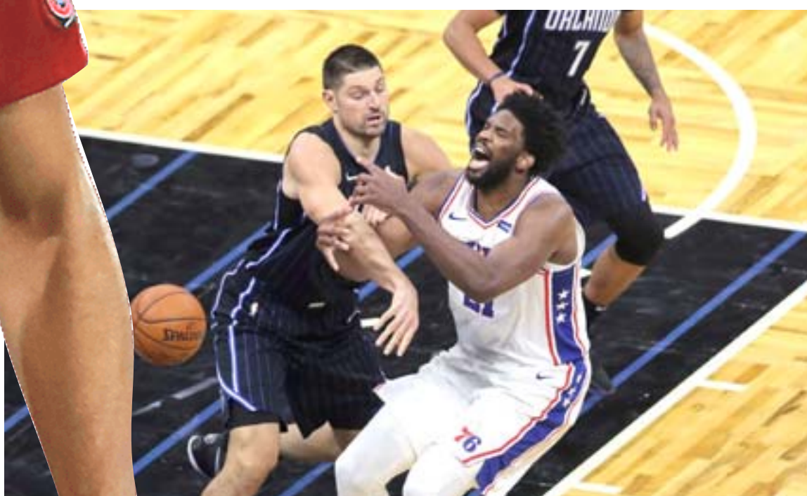
خسارة: الحق فيلادلفيا سفتني سيكسز خسارة الأولى هذا الموسم بأورلاندو ماجيك