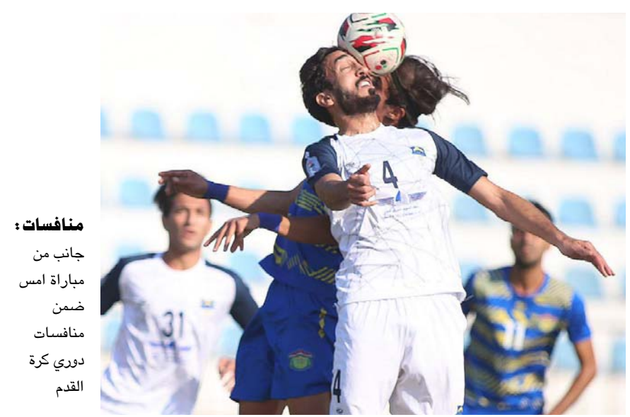
منافسات : جانب من مباراة اسس ضمن منافسات دوري كرة القدم