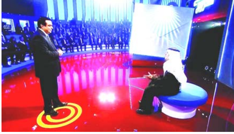
إبداع: نشاطات متعددة وبرامج متميزة لجورج قرداحي