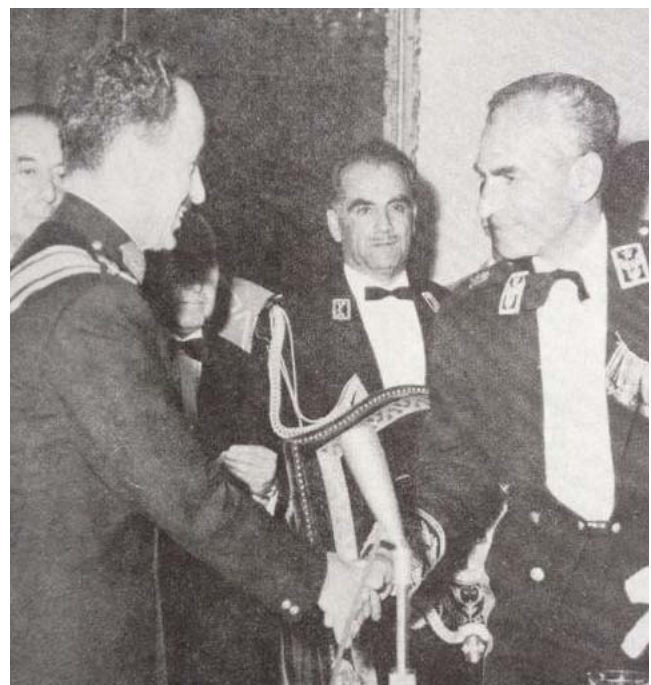
شاه ايران يصافح عارفا

تدل على توتره وخيبة امه. وكان اكثر ما حز في نفسه ان احد قادة الجيش ممن كانوا يسندونه قد تقدم إلى عبد الرحمن عارف والى عليه التحية العسكرية قائلاً ( 1967 وقد لست منه الكياسة والاحترام وتجنب الدخول في الصراعات السياسية مما جعله العظيم عبد السلام عارف).