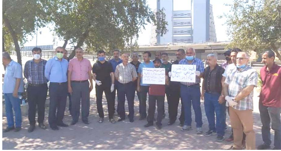
تظاهرة: عشرات الموظفين يتظاهرون أمام مبنى وزارة المالية للمطالبة بمستحقاتهم

بغداد - الزمان تظاهر عدد من الموظفين أمام وزارة المالية للمطالبة بصرف الرواتب المتأخرة منذ مدة . وقال شهود عيان أن (عددا من الموظفين الذين تم تحويلهم من المعهد السياحي إلى وزارة التربية تظاهروا أول أمس أمام مبنى الوزارة في بغداد للمطالبة بصرف رواتبهم المتأخرة منذ ستة شهور)، مشيرين إلى أن (المتظاهرين هدوا بالتحديد في حال عدم الاستجابة للمطالبة الحقة أو تسويةها) من جهة أخرى، قرر مصرف الرافدين إرجاء إستيفاء قروض القطاع الخاص لشهرين.