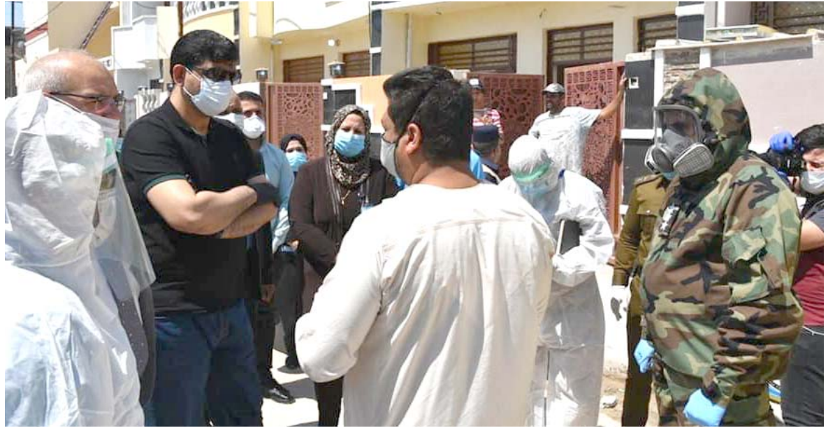
فحص مدير صحة الكرخ يقوم بجملة فحص وتعقيم في منطقة ابو دشير ببغداد