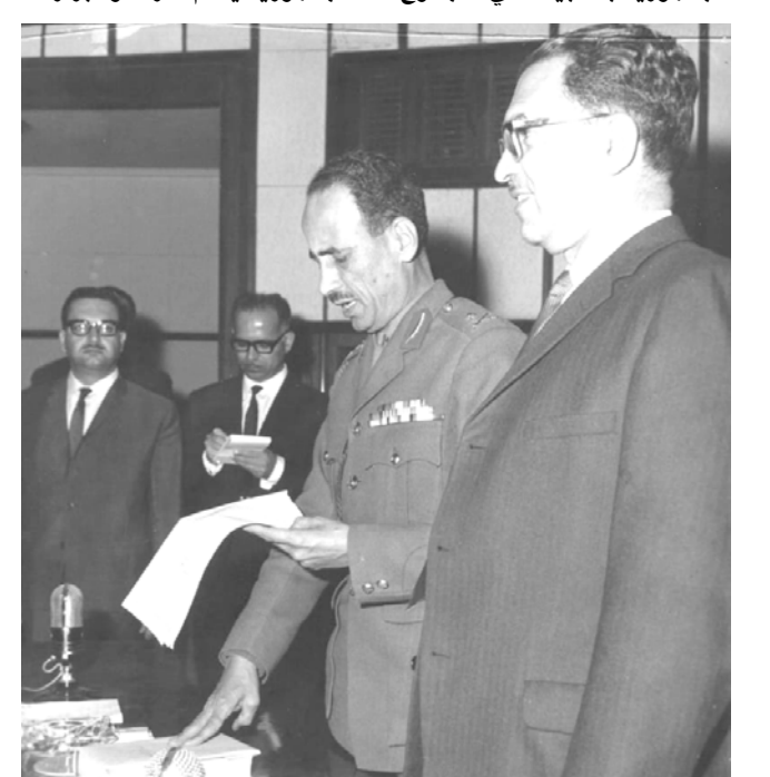
عبد الرحمن عارف يؤدي اليمين الدستورية ويبدو الى جانبه عبد الرحمن البزاز

الرئيس الراحل لهذا المنصب لكن وزير الدفاع العميد الركن عبد العزيز العقيلي يدعمه عبد قليل من الضباط رشع نفسه هو الآخر لهذا المنصب، وفهمنا في حينه استعداده لالاشتراك في مجلس رئاسي يحل محل منصب رئيس الجمهورية يضم عارف والبزاز.