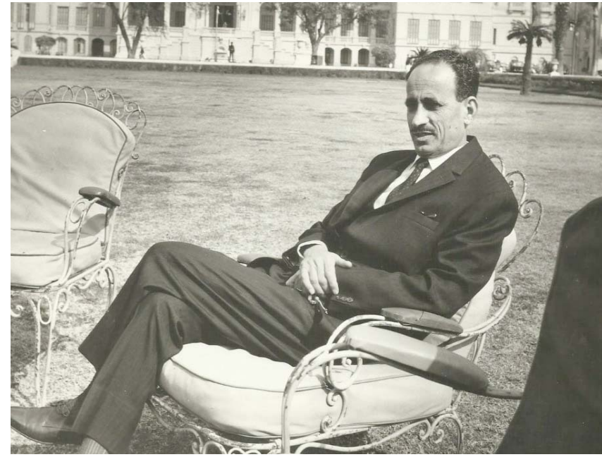
عبد الرحمن عارف يجلس في حديقة القصر الجمهوري

في ما من من القتل أو السجن عندما أطيح بحكمه عند تسلم حزب البعث الحكم عام 1968 فقم نفيه إلى الخارج ثم عاد إلى بغداد ليعيش فيها مثل أي مواطن.