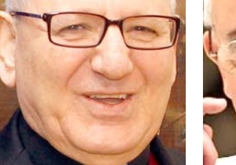
لويس روفائيل ساكو

من جهته تراس البابا فرنسيس الثاني قداس أحد الشعائين في كنيسة القديس بطرس والتي خلاله عطف أحد السباسبين، الا يقعدوا على ضروره ان لا يفقد القادة السياسيون انسانيتهم، بل ان يكون نقفي كورونا والحروب والصراعات الموجودة في أكثر بلدان، مع الألف القتلى والجرى، وملابئ النازحين، وتدمير البنى التحتية، فرصة لهم لمراجعة استراتيجياتهم السياسية وتصحتها، وتقديم اجوبة متمسدة لاحترام الحياة بكل اشكالها، واحترام البيئية والحد من التلوث والتغيير المناخي، والكف عن تصنيع الاسلحة الفتاكة التي تصنع الموت مضافا لقد كان الوقت للقاءة السياسيون ان يحترموا حقوق الانسان، ويتبنوا سلوكيات جديدة، وقوانين مناسبة تضمن علما خالياً من الحروب، والصراعات، والقتلى، والخوف والفقر. لقد ان الاوان لكي يحددوا عن خطة شاملة لبناء مجتمع أكثر سلاماً وازدهاراً، حيث يتم تطبيق العدالة الاجتماعية وخلق بيئة نقيصة، من اجل حياة أفضل). وقال ساكو في القول انه(لعل التزاماً عند الصبح القيامه مع كافة كورونا، بنين صفائنا، فنحنه من كبريتا بقوة واصرار لتحمل مسؤولياتنا كاملة، حتى لا نتراجع امام انسانيتنا وعالمنا).