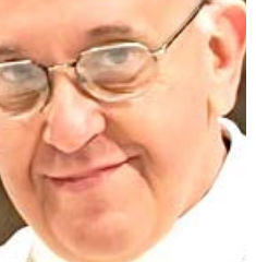
البابا فرنسيس الثاني

ادراك الخطر الحقيقي الذي يفرضه كورونا. قبل قوات الاوان، مؤكدا الحاجة الى التقد الذاتي والتغيير مشددا على ضروره ان لا يفقد القادة السياسيون انسانيتهم، وان يكون نقفي كورونا والحروب والصراعات، فرصة لهم لمراجعة استراتيجياتهم السياسية وصحتها. وقال ساكو في رسالة وجهها لمناصرة عبد الفصح انه (لا يزال هذا الوفاء بالرغم من الاجراءات الوقائية في جميع أنحاء العالم، يخصص كورونا الاالى الأشخاص، ولا تزال أعداد الإصابات ترتفع بسرعة يوما بعد يوم، مما يهدد حياة البشر صحيا واجتماعيا واقتصاديا. كما يترافق عدد الأشخاص الذين يقدون وظائفهم ومصدر رزقهم بشكل يومي. لذا على المجتمع الدولي والمؤسسات الدولية والمنظمات غير الحكومية ومنظمات المجتمع المدني من اجل حياة أفضل، تقديم اجوبة متمسدة لاحترام الحياة بكل اشكالها، واحترام البيئية والحد من التلوث والتغيير المناخي، والكف عن تصنيع الاسلحة الفتاكة التي تصنع الموت مضافا لقد كان الوقت للقاءة السياسيون ان يحترموا حقوق الانسان، ويتبنوا سلوكيات جديدة، وقوانين مناسبة تضمن علما خالياً من الحروب، والصراعات، والقتلى، والخوف والفقر. لقد ان الاوان لكي يحددوا عن خطة شاملة لبناء مجتمع أكثر سلاماً وازدهاراً، حيث يتم تطبيق العدالة الاجتماعية وخلق بيئة نقيصة، من اجل حياة أفضل). وقال ساكو في القول انه(لعل التزاماً عند الصبح القيامه مع كافة كورونا، بنين صفائنا، فنحنه من كبريتا بقوة واصرار لتحمل مسؤولياتنا كاملة، حتى لا نتراجع امام انسانيتنا وعالمنا).