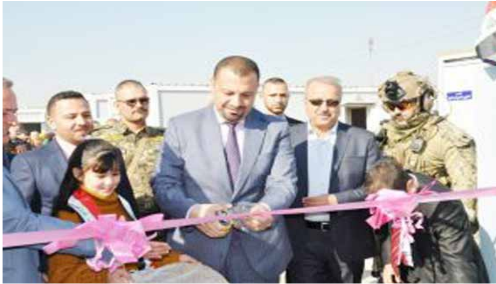
مدير عام شركة نقل الطاقة الشمالية يفتتح المبنى الجديد

وأمر بتخليدها ، كما زار سيادته مشروع إنشاء محطة جنوب الموصل الجديدة 132 ك.ف ضمن القرض الأمريكي والتي ستخفف الاحمال عن عدد كبير من مشاريع الاحياء والجانب الايمن مثل مناطق ( سايلكو الموصل والمنتجات النفطية وموصل الجديدة والصناعة القديمة واطلع على سير العمل واستمع الى كافة الاحتياجات ومتطلبات العمل وامر بتخليدها).