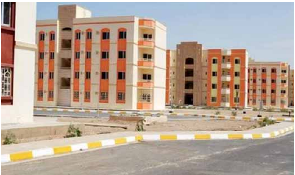
مجمع : احد المجمعات السكنية في بغداد

سلف وقروض واتخاذ الاساليب القانونية كافة بحق كل من يمنح الحسابات المفتوحة للمواطنين وفتحات اخرى في فروع المصرف ببغداد والمحافظات خلال كانون الثاني بلغت 1822 احساب توفير (جاري).