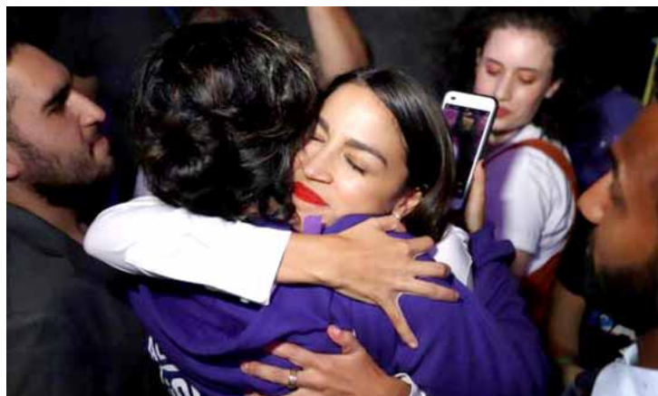
الكسانديا أوكاسيو كورتيز اصغر امرأة تنتخب عضوة في الكونغرس الأمريكي

الناس في أكثر من 60 دولة، بما في ذلك المملكة المتحدة. وتتمثل أهداف اليوم في تركيز الانتباه على صحة الرجال والأولاد، وتحسين العلاقات بين الجنسين، إلى جانب تعزيز المساواة بين الجنسين، وتبسيط الضوء على رجال يعتبرون قدوة لغيرهم.