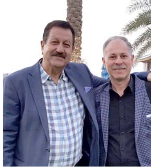
صالح كرم ومحمد رشيد

العمارة - الزمان تحتفي مدينة العمارة من خلال مهرجان العنقاء الذهبية الدولي للرجال بالدورة الرابعة (اسراليا - العراق) بالمخرج العراقي الكبير صلاح كرم وتكرمه بجائزة العنقاء الذهبية الدولية الذي يتراسها الايبي محمد رشيد احسبته لتجربته وتقديرها لمسيرته الثقافية. وسيقيم الكرنفال في فندق كورميك التركي. ووجهت ادارة المهرجان الدعوة للعوائل العراقية لحضور حفل الافتتاح، المخرج صلاح كرم وهو قادم من مدينة دبي سيكون برفقته مجموعة من الفنانين العراقيين بضمهم الفنان الرائد رضا الخياط. ع