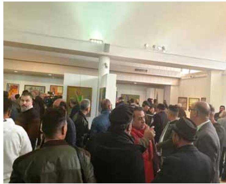
حضور كثيف من زوار المعرض

دون اجراء الانتخابات ومن ثم مد عمل الهيئة الادارية ستة اشهر ولكننا لن نبقى مكتوفي الايدي دون ان نبحث الحياة والجمال في ظروف تكاد توصف بالاستثنائية حيث يستمر الدمار بكل انواعه ضد ابناء الوطن ( واصف ) سيستمر منهجنا ولن نتوقف عن مواجهة ثقافة الموت بالتواصل مع الابداع وبيت روح الجمال والمحبة من خلال اقامة