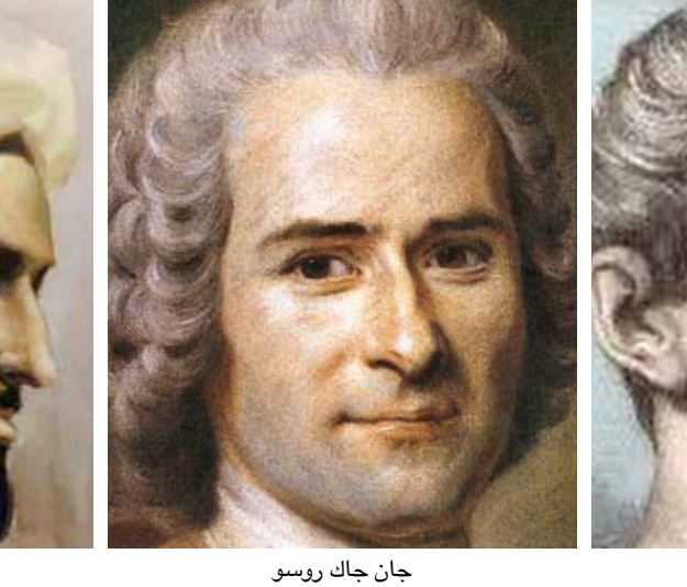
جان جاك روسو