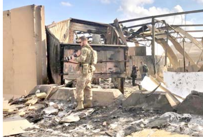
حطام: احد جنود قوات التحالف الدولي يتفقد حطام الابنية المدمرة في عين الاسد

من سبعة مواقع مهمة والبيات متفحمة وبنابات تحولت الى ركام). مشيراً الى (تدمير سيطرة الرادارات العملاقة بكافة أجهزتها، كما تم تدمير مقر الاستخبارات العسكرية الأمريكية بالكامل، وتدمير مخازن اسلحة وبيعت تفجّر بعد الهجوم بنصف ساعة تقريباً وتدمير مدرجات الطائرات المقاتلة، ومنصات للرصد الجوي وقواعد اطلاق صواريخ أرض جو بالكامل، مع تدمير أجهزة التحسس والاستشعار الجوي الحراري، وهذا اريد