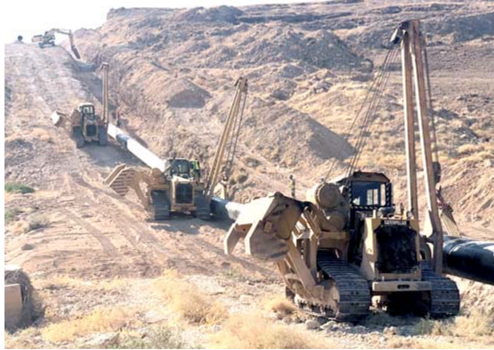
مشروع: المسات الأخيرة من تنفيذ مشروع الخط الاستراتيجي الجديد

وأكد السفير العراقي لدى إيران ان (حجم التبادل التجاري بين بغداد وطهران يبلغ حالياً 12 مليار دولار)، موضحاً ان (قادة البلدين اتفقا على زيادة هذا المستوى ورفعهُ إلى 20 مليار دولار)، وتابع ان (العراق تمكن من استحصان إعفاءات فيما يخص الطاقة لأن هذه أهم مورد حيوي بالنسبة للعراق