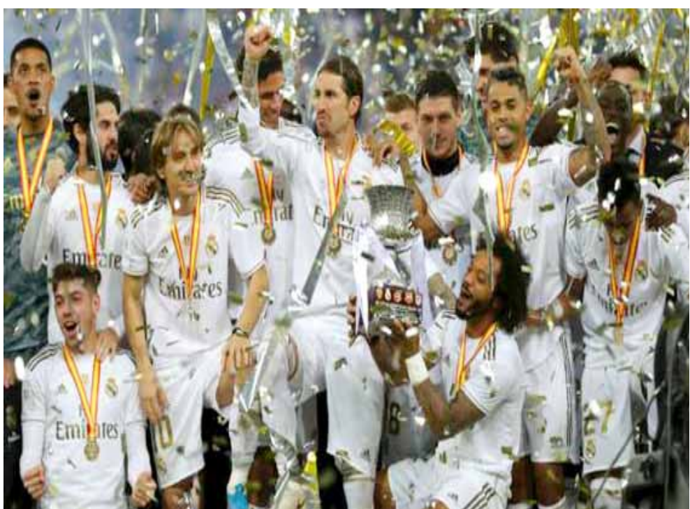
توقيع نجم ريال مدريد في احراز كأس السوبر الإسباني

صاروخ مبادرا إلى هدفه رقم 14 في بطولة السوبر الإيطالي. وشهدت الدقيقة 19 سقوط مريح ديميرال بشكل خاطئ على أرضية الميدان، وذلك أثناء مشاركته في ركلة حرة لفرقة، يتعرض لإصابة قوية أجبرته على الخروج من الملعب مصاباً، ليدفع المدرب ماوريسيو ساري، بامتياز دي ليخت عوضاً عنه. وفي الدقيقة 32 سقط نيكولو زانولولو نجم روما على أرضية الملعب، إثر تدخل عنيف من دي ليخت، ليحصل الأخير على بطاقة صفراء، ويغادر نجم الناديين المباراة باكياً ومتأثراً بإصابته، ليدخل أودنير مكانه. وفي الدقيقة 68 حصل روما على ضربة جزاء تحسباً عن طريق تقنية الفيديو بعد لمسة يد من الكيس سانثرو، ليقتحم لها ديجو بيروتي ويجولها إلى هدف رائع، معلناً عن تقلص النتيجة لهدفين مقابل هدف، ولم تشهد الدقائق المتبقية، أي جديد على مستوى النتيجة. لتختفي المباراة بانتصار فريق السيدة الجوز بلقب العاصمة الإيطالية.