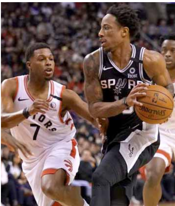
جان من منافسات سلة المحترفين

واشنطن - وكالات انتفض سان أنطونيو سبيرز بعد التأخر بفارق 18 نقطة وفاز 105-104 أعلى تورونتو رابتورز في دوري كرة السلة الأمريكي للمحترفين، بفصل ثنائي ديمار ديروزان مساء أول امس الاحد. وسجل ديروزان 25 نقطة، منها 22 نقطة في النصف الثاني، ليمنح بذلك في تسجيل عشرين نقطة على الأقل في 11 مباراة متتالية. ومنع ماركو بلينيلي التقدم لسبيرز بعد رمية ثلاثية في الثواني الأخيرة ثم انسحب الفارق إلى أربع نقاط قبل أن يقلص كايل لوري الفارق إلى نقطة واحدة بعد رمية ثلاثية قبل خمس ثوان من النهاية. وأحرز بويان بوجدانوفيتش 31 نقطة، ليحقق بوتا جتان لمواصلة انتصاراته المتتالية بالفوق 127-116 على واشنطن ويزاردز في مباريات.