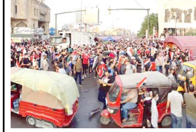
انتشار: عجلات التكتك تنتشر في ساحة التحرير

بغداد - حمدي العطار اليوم كتشف ساحة الاعتصام والإحتجاجات عن هويتها المستقبلية بعد ان كان الغفوض بلف مواقف المتظاهرين. كنا نعرف ما يرفضون ولا نعرف ما يريدون. قد يكون من ينقص هذه الهوية هو (القيادة الموحدة) وهي ركن مهم من هوية أي ثورة أو إنتفاضة، تعمل على توحيد الرؤى وتحديد الاهداف ورسم البرامج والعمل على تحقيقها بنجاح. ما حدث من تحول في ساحة التحرير هو التدخل المباشر للمتظاهرين في طرح 5اسماء لإختيار منصب رئاسة الوزراء. وعند التعن في الاسماء المطروحة تشير الى ان جميع هذه الاسماء كان لديها مشاكل من احوال السلطة الحالية ومنها من هو مطلوب للفضاء أو تعرض الى عقوبة العزل والتجميد من قبل النظام الحالي