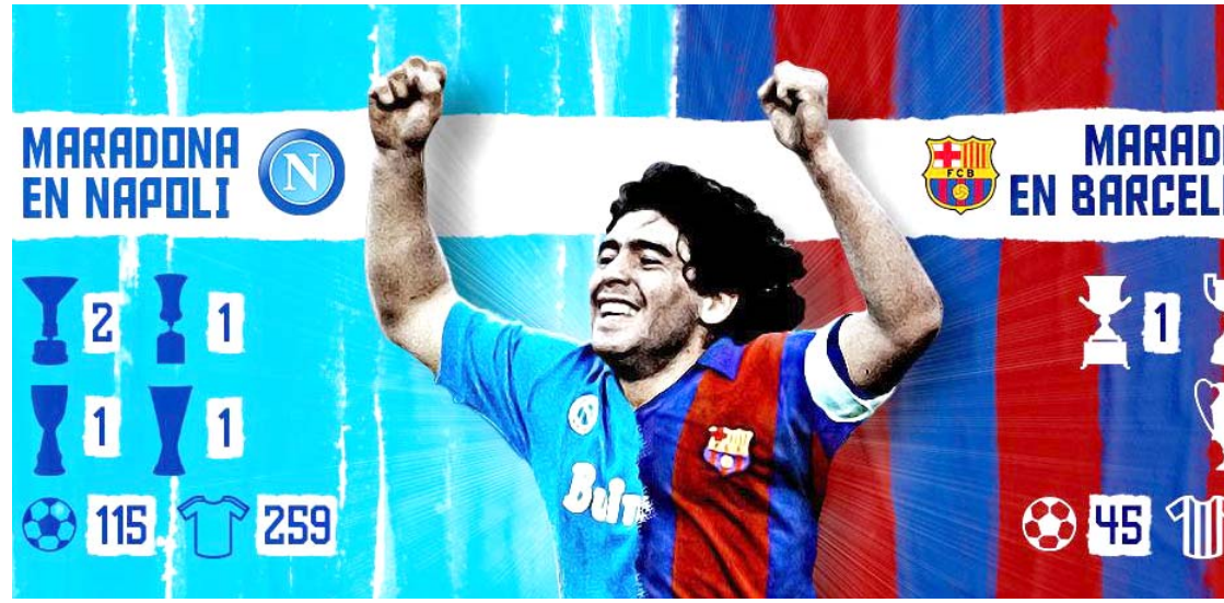
تكريات: مواجهة برشلونة ونابولي في دوري الإطال ترجعا إلى ذكريات مارادونا

□ مدن- وكالات - أسفرت قرعة دور الـ 16 من دوري أبطال أوروبا، في مقر الاتحاد الأوروبي بمدينة نيون مواجهة تجمع يوفنتوس السويسرية، عن مواجهة تجمع يوفنتوس بنظيره ليون الفرنسي ومن المقرر أن يُقام لقاء الذهاب في 2020 فبراير/ شباط 26 بفرنسا، على أن يُقام لقاء الإياب 17 مارس/ آذار بتورينو. ويبدو أن القرعة كانت رحيمية بيوفنتوس، لاسيما وأن البياتكونيري كان من المحتمل أن يواجه فرقا ذات تاريخ وخبرة أكبر من ليون، مثل ريال مدريد، تشيلسي، يوروسيا دورتموند وتوتنهام هوتسبير. ويمتلك يوفنتوس حظوظا أكبر من ليون في عبور دور الـ 16 والتأهل لدور ربع النهائي من مسابقة الأبطال، خاصة وأنه سيستضيف مباراة الإياب على ملعبه بالباتز ستاديوم بتورينو.