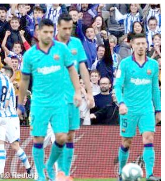
برشلونة تسقط في فخ التعادل مع ريال سوسيداد بالليغا