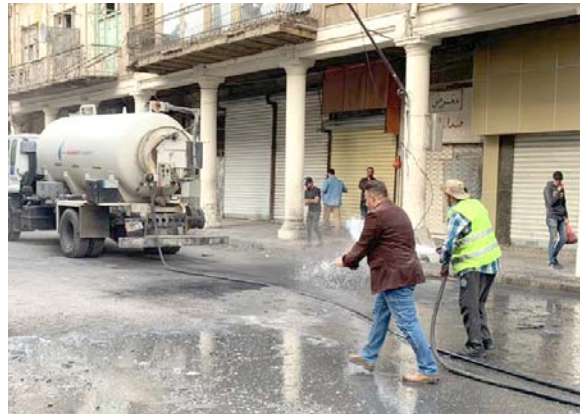
بغداد - الزمان

اعادت امانة بغداد ضخ الماء الى مناطق جنوب بغداد واسيما احياء الشرطة والرسالة والشهداء بعد إصلاح الكسر الحاصل في احد الأنابيب الرئيسية والناقلة للماء ويجهد متواصل ويساعات عمل استمرت منذ صباح يوم الخميس. وكانت الامانة قد نوهت الى ان انقطاع الماء في بعض المحلات السكنية جنوب بغداد هو بسبب كسر أنبوب رئيسي.