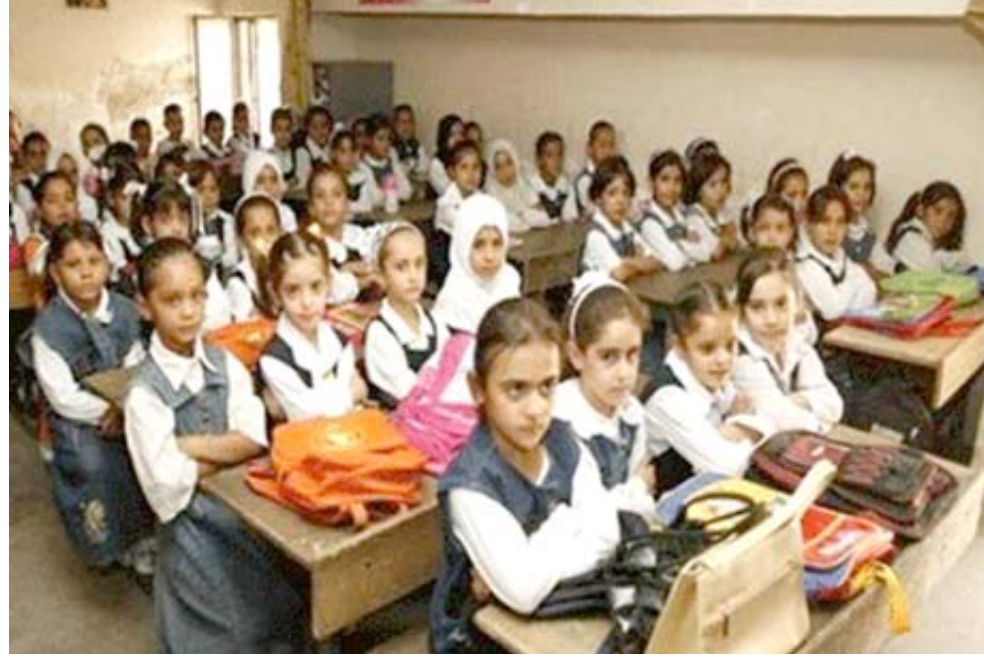
تلاميذ : تنشئة الاطفال من خلال المدارس بحصن المجتمع

او حكومية وتلاه المغرب بمعدل 31 في المئة ثم السودان بمعدل 24 في موضعا ان (القطاعات الأكثر تلقيا للرشا هي الشرطة والمرافق العامة كالماء والكهرباء واستخراج الأوراق الرسمية والمحاكم وغيرها)، وتابع ان (الشرطة اللبنانية جاءت في المقدمة، إذ دفع 36 في المئة من اللبنانيين الذين شملهم المسح رشا مقابل خدمات معينة وجاء السودان في المرتبة الثانية بمعدل 33 في المئة ثم المغرب بمعدل 31 في المئة) . وبشان خدمات المرافق العامة أكد التقرير ان (لبنان تصدر مرة أخرى بمعدل 51 في المئة من المحوئين الذين اشاروا الى الاستحسانة بوساطة تسهيل الحصول على خدمات الكهرباء والمياه في الأردن وفلسطين بمعدل 21 في المئة لكل منهما).