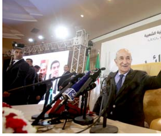
مؤتمر : الرئيس الجزائري المنتخب بعد الانتهاء من مؤتمر صحفي امس

تكاثف الجميع). وتابع نصر الله ان حزب الله يصر على ان تضم الحكومة حليفه السياسي التيار الوطني الحر، الذي يمثل أكبر كتلة سياسية مسيحية في لبنان. واغرب نصر الله عن اماله في تكليف رئيس جديد للحكومة يوم غد الاثنين لكنه قال إنه حتى في حال حدوث ذلك فإن عملية التاليف لن تكون سهلة.