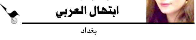
ابتهال العربي بغداد

مشاهد كهذه تكثرت في وقت ما وظروف ما كالجين الذي يجلس في بطن أمه لفترة ينتظر الخروج ليكتشف ويحيا . ولا يوجد شيء قادر على إرجاعه إلى رحم الأم من جديد .