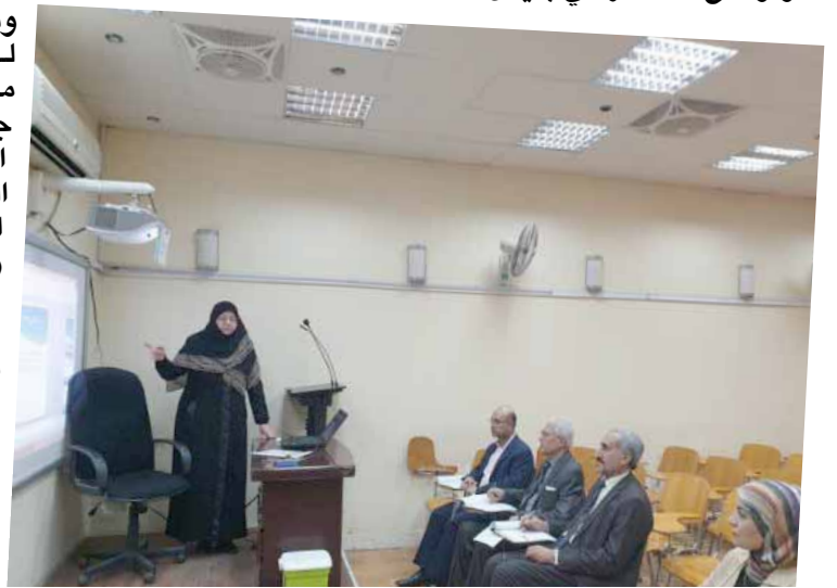
محاضرة في مركز بحثي