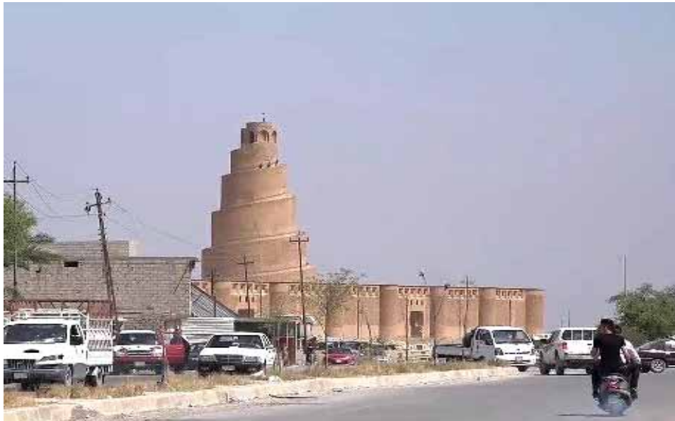
شاهد : المئذنة الموية لشاهد حضاري في سامراء