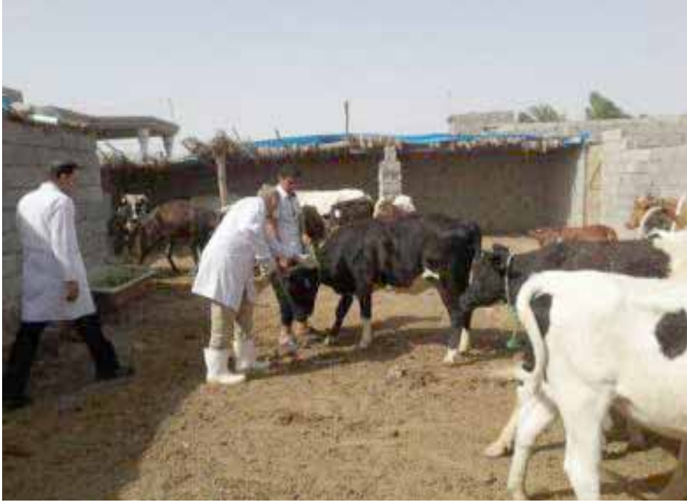
مكافحة : فرق بيطرية تكافح مرض الحمى القلاعية

الشركات الحكومية، والمساهمة بدعم القطاع الزراعي والقطاعات الأخرى والنهوض بالاقتصاد الوطني). اصناف البذور وضمن برنامج إكثار الرتب العليا لأصناف البذور وبالتعاون مع قسم بحوث نيونوى تم تنفيذ ورشة العمل الموسومة ( واقع محصول الشعير في المنطقة الديمية ) . الورشة تضمنت محاور عدة منها ( برنامج الشعير ودوره في توفير بذور الأساس ذات النقاوة الوراثية العالية، تاريخ وواقع زراعة الشعير، أهم الأصناف المتداولة، الجوانب الاقتصادية للمحصول، آفاق تطوير زراعته،