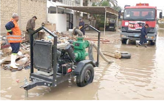
مياه: سيارات حوضية تسحب مياه الامطار من حي سكني ببابل

900 رحلة جوية، فيما كان يتوقع ان يكون آخر أيام السنة ازدحاماً بالنسبة للطرق الرئيسية والمطارات كما تقطعت السبل بالعديد من المسافرين الذين يحاولون العودة الى منازلهم امس الاول بعد عطلة عيد الشكر. وقالت الهيئة الوطنية للأرصاد الجوية أنه من المتوقع ان تؤدي العاصفة إلى تساقط ثلوج يبلغ ارتفاعها نحو 30 سنتيمتراً في الجانب الغربي من منطقة مترو بوسطن). وتزايد إلغاء وتأجيل الرحلات الجوية ومعظمها كان في مطارات سان فرانسيسكو وبوسطن. ووقع