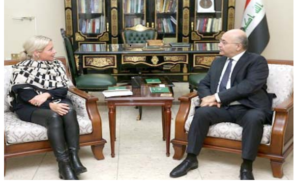
لقاء: رئيس الجمهورية يلتقي ممثلة الامين العام للامم المتحدة