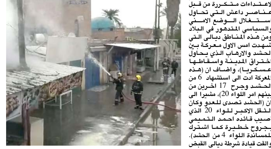
أخماد: رجال الدفاع المدني يخمدون حريقاً في الكرادة الشرقية ببغداد

بغداد - عبد اللطيف الموسوي القيادة نهاد محمد في بيان امس إن (مفارز من قسم مكافحة الاجرام التابعة لشرطة المحافظة تكثت من القاء القبض على ستة مطلوبين وفق قضايا جنائية متعددة في مناطق متفرقة في المحافظة). مؤكداً ان (السيطرات الامنية التابعة لقسم