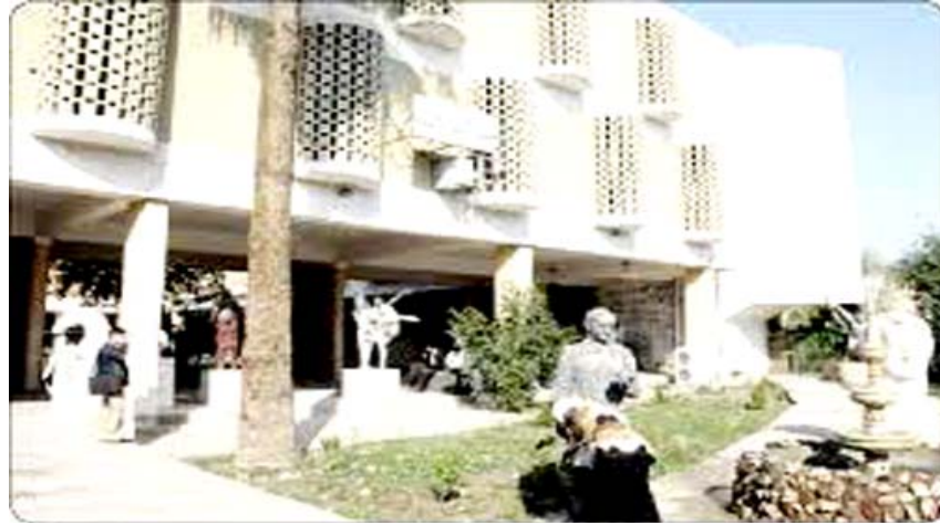
عمل جديد: مشهد من مسرحية (غربة) على خشبة معهد الفنون

عرضه باستمرار في ظل الظروف الحالية التي يمر بها البلد لعنا نفهم جميعا ان المواطنين العراقيين والعربية ومعاملة الدول للمهاجر العربي بطريقة غير لائقة. اما الجميل في العرض رغم قصر مدته استطاع ان يكشف لنا المعاناة العراقية بشكل اوسع وما يحدث فيه كانه مونودراما وكان الممثل رشيقا للغاية رغم حركته البطيئة ففي كل حركة وكلمة كان يقدم نموذجا من المعاني والدلالات بحيث جعل العرض اكتشافا للمتفرج وكان الممثل ينتقل بنا بثوان قليلة من موقف الى اخر الى الكوميديا والامر الاخير رغم هذا الكم من القمع الموجودة على المسرح سواء في السينوغرافيا ام الديكور الا انها لم تعق حركة الممثل، وهذا النموذج من العروض يحتاج دائما الى اعادة