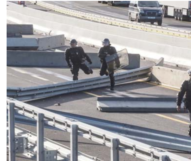
طريق: الشرطة تفتح الطريق السريع بين إسبانيا وفرنسا

الى ذلك أيدت المحكمة الدستورية في بوليفيا الثلاثاء تعيين جانين أنيز رئيسة مؤقتة للبلاد لئلا الفراغ في السلطة الذي خلفه إيفو موراليس.وجاء بيان عن المحكمة ليدعم تعيين أنيز البالغة 52 عاماً بعد أن فشلت جلسة تأكيد تعيينها في الكونغرس في تأمين النصاب القانوني.وأخذت المحكمة الى إعلان دستوري صادر عام 2001 يقضي بأنه لا ينبغي تعليق عمل السلطة التنفيذية، بحيث إن التالي في التسلسل يتولى الرئاسة بحكم الواقع. وأنيز النائبة الثانية لرئيس مجلس