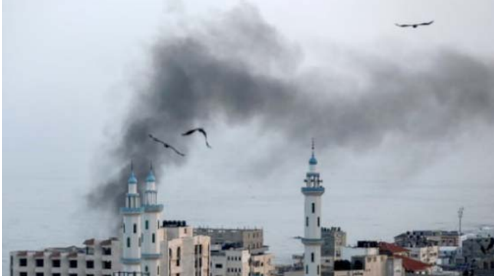
اعتداء طائرات اسرائيلية تعدي على اهالي غزة

وكان طعم الحصاد مرًا في أفواه بعض المزارعين الإسرائيليين على الحدود مع الأردن. فيسوم الأحد الماضي إنتهى رسمياً أجل اتفاق بدأ سريانه قبل 25 عاماً بين السبلدين وأتاح لهؤلاء المزارعين زراعة الأرض. بمقتضى هذا الاتفاق الذي كان جزءاً من معاهدة السلام المبرمة بين الأردن وإسرائيل عام 1994 تم الاعتراف بان قطعتين من الأرض على الحدود تخضعان للسيادة الأردنية وسمح اتفاق خاص للمزارعين الإسرائيليين بزراعة الأرض وللمزارعين بالتحويل في حديقة جزيرة السلام في المنطقة. إلا أن الأردن أعلن في 2018 أنه لا يريد مواصلة العمل بهذا الترتيب وذلك فيما اعتبر على نطاق واسع وجماعات متشددة منظمة أخرى المملكة منذ وقت طويل ويقضي عشرات المتشددين عقوبات السجن لمدة طويلة في الأردن حالياً. ويعد العاهل الأردني الملك عبد الله من أبرز زعماء المنظمة الذين حذروا من خطر الجماعات المتشددة. وخلال السنوات القليلة الماضية، هزت بعض الأحداث المملكة التي تفادت إلى حد بعيد الانفصالات والحروب