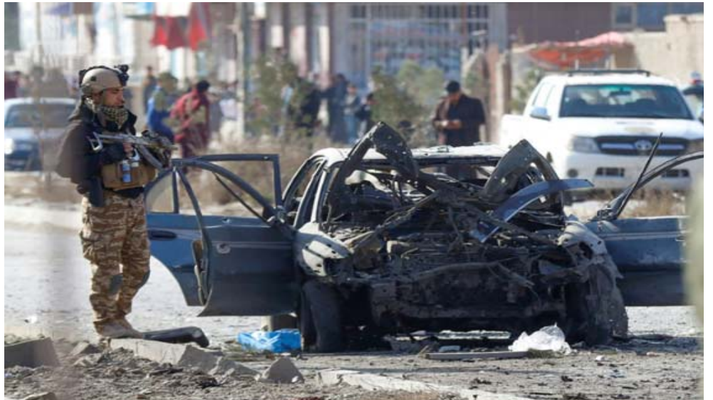
موقع: جندي أفغاني في موقع انفجار سيارة مفخخة في كابل

ولم تعلن أي جهة في الوقت الحاضر مسؤوليتها عن الاعتداء الذي وقع في ساعة ذروة.