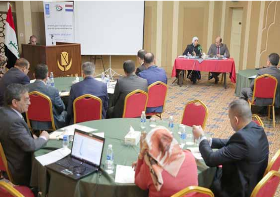
اجتماع: جانب من احد اجتماعات وزارة التعليم العالي

ومن بدرجتهم (المعينين بالوكالة) بتسيير أعمال تشكيلاتهم لحين حسمها من قبل مجلس الوزراء وانتهاء تكليف المدراء العمامين وكذلك العمداء ومن بدرجتهم ويكلف اقدم معاونيهم من حيث اللقب العلمي بتسيير اعمال تشكيلاتهم لحين تعيين البديل. وقرر السهليل تحويل جميع المختارين في الدراسة الصباحية والموظفين الاجراء البوميين في جامعات ومؤسسات الوزارة وكذلك العلوم والتكنولوجيا المدجة من بقاضون اجورهم على الموازنة التشغيلية الى عقود وفقا لقرار 315 لسنة 2019.