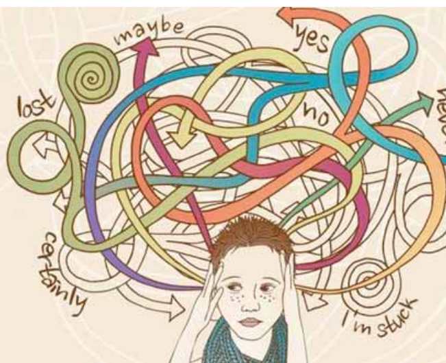
رسم تخيلي لتعقيدات سريان عمل العقل

ترتبط الأبحاث الحديثة بين العقول الهائنة وطول العمر، وفي دراسة افاد باحثون من كلية الطب بجامعة هارفارد، المنشورة في المجلة الطبية الطبيعية، ان الدماغ الهائئ مع نشاط عصبي أقل يمكن ان يؤدي إلى حياة أطول، حيث يرى الباحثون ان الدماغ الأقل نشاطا يستخدم طاقة الجسم أقل. ويقول الخبراء ان هناك عدة طرق لتهدئة عقلك، بما في ذلك التأمل، والاستماع للنشط، والأكل اليقظ، وهذه خمسة طرق لتهدئة عقلك عليك ان تكون أكثر وعيا بجسمك، عن طريق تخفيف الضغط ومتابعة مستوى الدهون لديك. ويعمل التأمل جنبا إلى جنب مع اليقظة لأنه يوفر مقياسا مفيدا لحالة الشخص العقلية. وفي نقاش مفعم بالحويوة، من السهل جدا التوقف عن الاستماع لآخرين وانت تنتظر فرصتك للتحدث، لذا عليك ان تركز ولا تقع في فخ السرحان. ومن المهم ان تضع حدودا وان تخبر نفسك بوعي أنك تقضي بعض الوقت لنفسك. وتخبر من الناس لا يعتبرون بالإرهاق حتى يتم حرقهم بالكامل، يمكن ان يساعد التعرف على علامات الإرهاق قبل البدء في إعادة