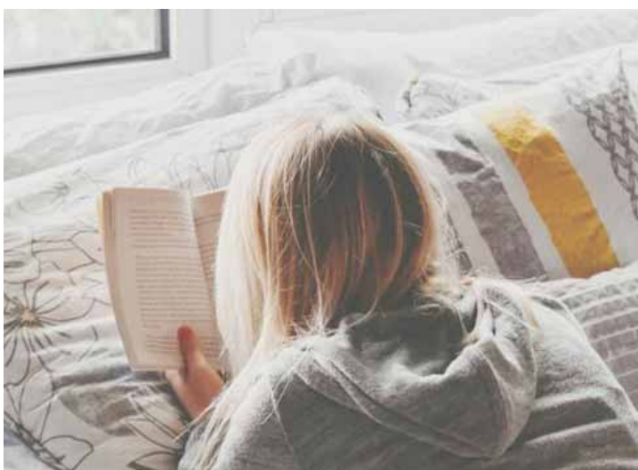
مصابة بمرض السكري في سريرها