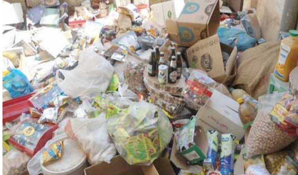
مواد منتهية الصلاحية تم إتلافها في بلدروز

ديالى - سلام الشمري أعلنت دائرة صحة ديالى عن إتلاف أكثر من 165 كيلو غراما من المواد الغذائية وأكثر من 525 لترا من المشروبات غير الصالحة للإستهلاك البشري خلال الشهر الماضي، وقال مدير اعلام صحة ديالى فارس العزاوي لـ (الزمان) امس إن (فرق الرقابة الصحية للإستهلاك البشري) و اشار العزاوي ، انه (تم إستيفاء قرابة مليوناً و638 ألف دينار عن أجور الخدمات التي تقدمها الرقابة الصحية للمحال الغذائية