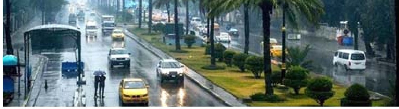
هطول : شوارع بغداد بعد هطول الامطار اول امس

واضحة في تصريحاتها للمواطنين عالميا قالت هيئة الاذاعة والتلفزيون اليابانية ان عدد القبلى جراء الاطمار الخريفية التي سببت فيضانات وانهارات ارضية في شرق اليابان ارتفع إلى عشرة اشخاص، وذلك بعد اسبوعين من تعرض المناطق نفسها لإعصار هاغيبيس، واجتاحت الانهيارات الارضية المناطق التي غمرتها المياه في مقاطعتي تشيبا وفوكوشياما بشرق وشمال شرق البلاد اول امس الجمعة، وغمرت المياه المناطق في ثالث عاصفة ممطرة تتعرض لها خلال اسبوع اسابيع وهطلت في بعض الاماكن، خلال 12 ساعة، كميات من الامطار مماثلة لما يسقط في شهر وصدرت اوامر لإجلاء ونصائح للسكان بامتداد قسم كبير من البحر الشمالي الذي تعرض بالفعل لضربات إعصارين منذ الشهر الماضي. وبلغ منسوب الامطار التي هطلت على مدينة اوشيكو في تشيبا 283.5 ملممتر على مدار 12 ساعة، وحذرت السلطات من احتمال حدوث المزيد من الانهيارات الارضية والفيضانات،وقتل إعصار هاغيبيس ما لا يقل عن 88 شخصا عندما اجتاح وسط وشرق اليابان بامطار غزيرة ورياح شديدة ولا يزال سبعة في عداد المفقودين كما اصيب اكثر من 300.وفي الولايات المتحدة قال مسؤولون في المرافق والاطفاء ان حريق غابات اججته الرياح العاتية ارغم نحو الف شخص على الفرار من منازلهم في بلدة تشنتر