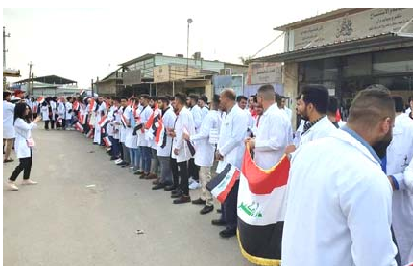
بغداد - فائز جواد امتدت التظاهرات الشعبية التي عمت بغداد والمحافظات خلال اليومين الماضيين إلى الجامعات وعدد من المدارس في بغداد برغم توقف الدوام عن معظمها في المناطق.

مضيفة ان(تسبقات عدة اعلنت تاجيل التظاهرات) وتابعت ان (تسبقات وناشطين البلغونا يدخل مندسين وان الساحة اصبحت لتصفية الحسابات، لذلك اعلنوا (الزمان) امس ان بعض زملائهم المنتهزين حيث تم انسحاب المظاهرين السلميين من ساحات التظاهر) بحسب البيان الذي اشار الى ان (عمليات قتل وتصفيية حساسيات وأخلافات قديمة يتم تسويتها اثناء التظاهرات). انضباط عالي مضيفا ان (اغلب منظمي التظاهرات البلغونا بانفسهم لما حصل في محافظات عدة، نتيجة من يريدوا (فوضى) بحسب تعبير البيان واكد ان (هناك انضباطا عاليا من القوات الامنية تم استغلاله من قبل بعض المراهض لاساعة تفرغ للمظاهرين من جهة للدولة من جهة اخرى) في غضون ذلك اعلنت تسبقات تظاهرات البصرة انها قررت تاجيل التظاهرات الى يوم 1/1/2020/وقالت في بيان ان هذا القرار يأتي لاعطاء مجال للحكومة لتنفيذ وعدها خلال شهرين فقط ونزولا عند رغبة المرجعية الرشيدة وحقن دماء شبابنا المظلوم والمجروح،) واضافت ان (موعدنا راس السنة الميلادية) وبكافة المرجع الأعلى السبستاني (وبعدها سوف نزل على عرشهم وقد اعد من انذر) وخلصت الى القول (هذا تهدد بان نصعد من احتجاجنا من السلمى الى المواجهة المباشرة مع الحكومة)، منبيرة الى (ان مطالب جماهيري ثابتة ومعروفة، وفي شان متصل اعلنت قيادة عمليات بغداد امس السبت التزامها بعدم استخدام العناد الحي واحترام المظاهرين السلميين، داعية المواطنين والممتلكات العامة والخاصة، الى ذلك وصفت قيادة عمليات بغداد قيام مظاهرين بإجبار أصحاب عجلات