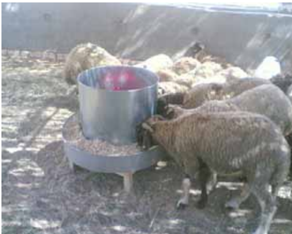
مشروع: قطع من الاغنام في مشروع للثروة الحيوانية يحقل بجري حمد محصوله من الحنطة