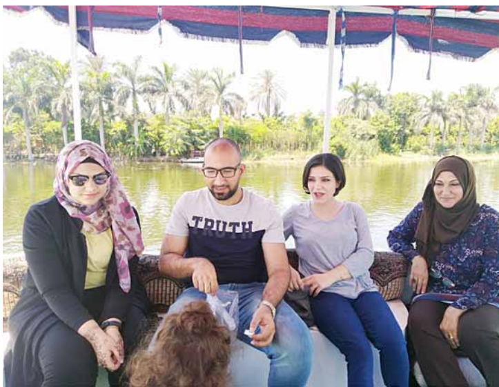
لقطة القناطر معلم سياحي مصري

الخبديوي اسماعيل من دول اوروبا مجموعة من الانشراح العمرة النادرة لزراعتها في المدينة، عند جولتنا في منطقة القناطر بالبرك تعرفنا على كيفية عمل القناطر والتحكم بمياه النيل عند الفيضان والجفاف والتحكم في يمكن فتحها او غلقها لحجز الماء وقت الفيضان. كما تم مشاهدة قصور نجوم السينما في هذه المدينة وهي تطل على نهر لنهر النيل يسمى رشيد ويشكل هذا النهر مع نهر النيل ديماط (مثلاً) يطلق عليه (دلتا النيل) بيوت وقصور لنجم عادل امام وليلى عليوي و محمد