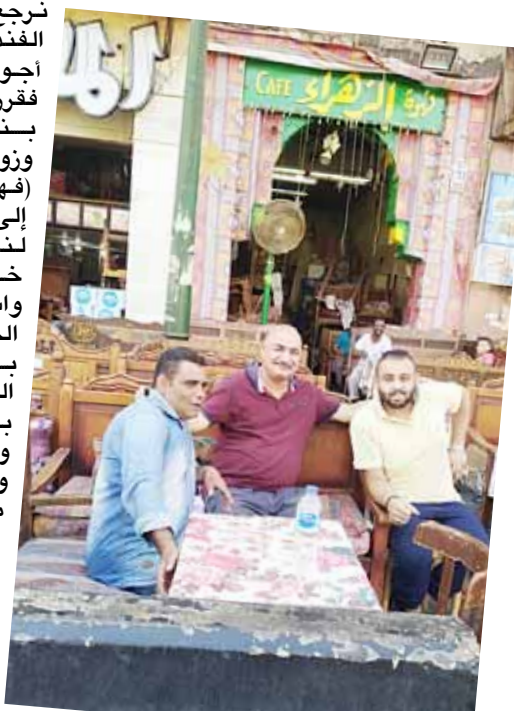
(الزمان) في خان الخليلي شعبة كما يسمونه فكان

عند زيارتنا إلى القناطر الخيرية التي قرر حاكم مصر وقائد نهضةها (محمد علي باشا) تطوير الزراعة وتغيير نظام الري من طريقة (الحياض) والتي يتم فيها زراعة الأرض في موسم واحد، ولا يزال إذ فيها الأحاصيل الشتوية، أخذ محمد علي بفتح الترغ وتطهيرها وتوفير مياه الري في معظم السنة، لا سيما بعد إقامة القناطر عليها وإنشاء الري الصناعي في (الوجه الحبري) بعد أن كانت كميات كبيرة من مياه الفيضان تضيع هدراً في البحر، وحدث ذلك سنة 1847 بعد مر 43 سنة من حكمه لمصر واكل سعيد باشا هذه القناطر. واصبحت من ذلك الوقت منطقة القناطر من الأماكن الازرية التاريخية والسياحية، وتتميز بوجود عدد من القصور التاريخية التي اقامها حكام مصر في العصر الملكي واخذوها استراحات لقضاء اجازاتهم وفترات الاستجمام، واحضر