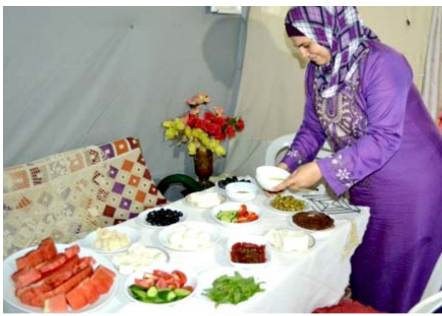
مائدة افطار صحية

الجوع الشديد بعد ساعات قليلة من الإفطار). وأشارت الى (ان هذا السكر الزائد يخترق في الجسم، ما يتسبب في إبطاء عملية الهضم، وبالتالي قد يتسبب في زيادة الوزن مع السوخت.