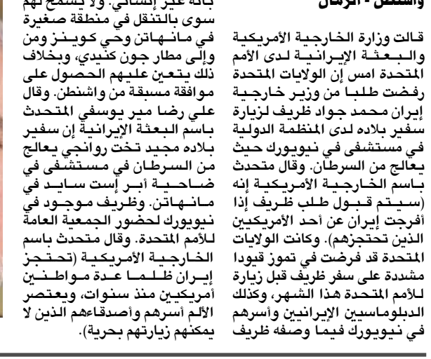
محمد جواد ظريف