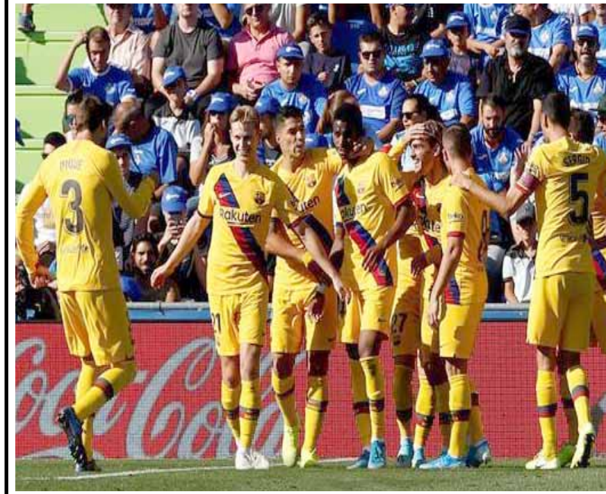
الليغا بينما يتجمد رصيد خيتافي في المركز 49. وبهذا الانتصار ختافي في 7 نقاط في المركز عشر نقطة في وصافة ترتيب الليغا عشرين.