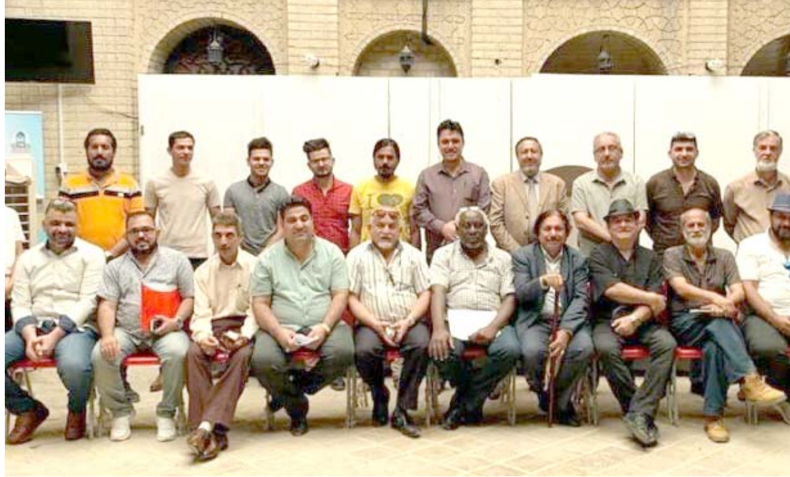
المشاركين في ورشة الابداع