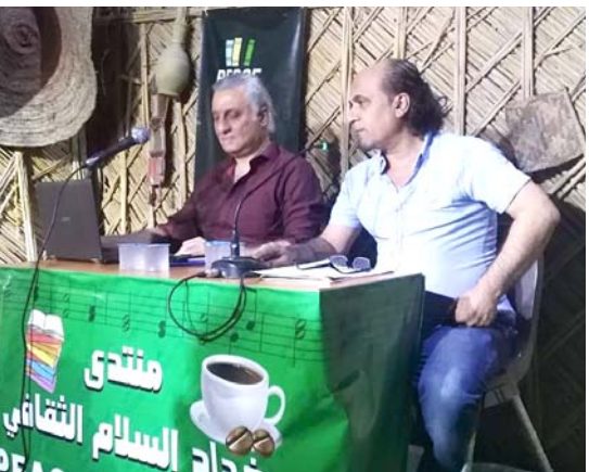
ادارة منتدى بيس الثقافي