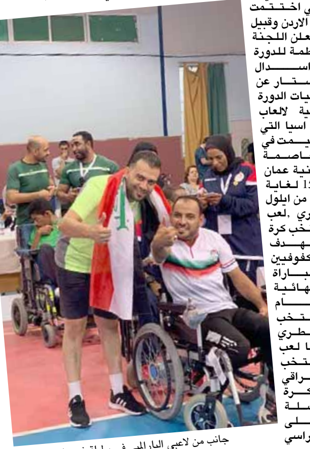
جانب من لاعبي البارالمبي في بطولة غرب آسيا

بغداد - هشام السلطان حصل العراق على لقب دورة غرب آسيا للالعاب البارالمبية بنسختها الثانية بعد ان تصدر لائحة الائمة بفارق كبير عن اقرب منافسيه الارجن المضيف للدورة وجاء فوز العراق باللقب قبل خوض آخر مباراتين له في المنافسات التي اختتمت في الارجن وقبيل ان تعلن اللجنة المنظمة للدورة عن استبدال السستر عن فعاليات الدورة الثانية لالعاب غرب آسيا التي اقيمت في العاصمة الاردنية عمان من 15 لغاية 22 من ايلول الجاري. لعب منتخب كرة السلة الهدف للمكفوفين المباراة النهائية المنتخب القطري فيما لعب المنتخب العراقي لكرة السلة على الكراسي