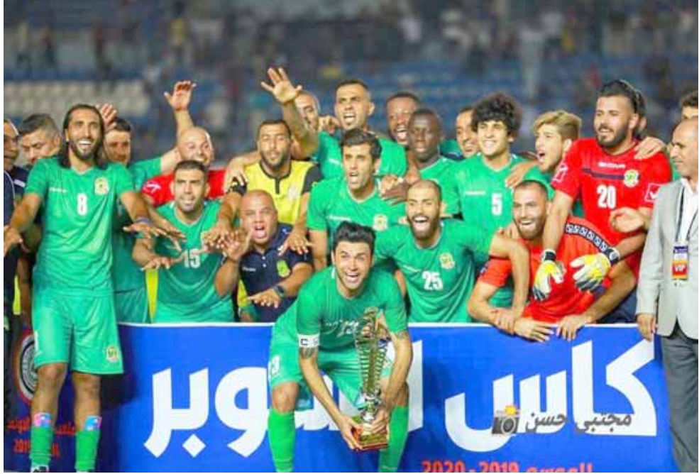
كأس السوبر 2020

عادل مخيب ونتيجة التعادل السليمة لاربل مؤكدا ستزيد الضغط على مهمة اكرم محمدمسلان ولاعبى الفريق بعد خيبة التعادل مع نطف الجنوب بعدما فرط بتقطعتين في ظل ظروف لعهد وقتت الي جانبه لكنه لم يقدم تصعب بالفريق الذي مهم جدا ان يستقبل الموسم بنتيجة ايجابية ويكون كامل العلامات بسجلة والسوري وترفع من معنويات اللاعبين لتحضير لخوض لقاء الجوية الاختياري الحقيقي للمدرب واللاعبين وان يخرر عقدة مباريات الذهاب من جانبه واجه زاخو بعودته الجديدة صعوبات اللقاء الاول خارج ملعبه وهو متاعني منه كل الفرق من دون استثناء لكنه لا يريد ان يكون رقما في السوري تتعامل مع الفرص التي تمنحت التقدم وتكون مصدر خطورة ليس في مكانك بل في اي ملعب كشف نادي البقاء كلما امكن ويبيقي الامر مرهون بجهود اللاعبين الذين يعلمون ان الامور مختلفة هذه المرة.