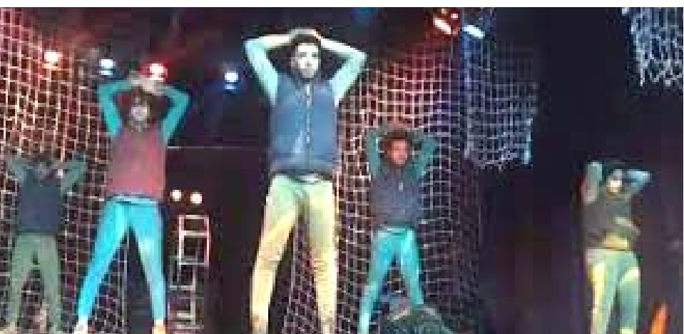
مشهد من مسرحية (أيام صفراء)