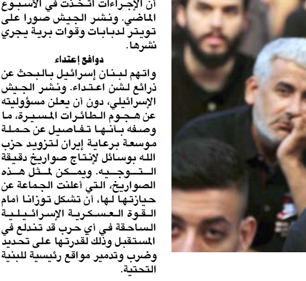
متابعة: لبنانيون يتابعون خطاب نصرالله في الضاحية الجنوبية لبيروت مساء السبت

إطار قوة الأمم المتحدة المؤقتة في جنوب البلا (يونيفيل)، وفق ما أفاد الجيش اللبناني وتحدثت اممي. ومدت مجلس الأمن الدولي الخميس لعام واحد مهمة قوة الأمم المتحدة المؤقتة في جنوب لبنان، محرراً من اندلاع نزاع جديد بين هذا البلد واسرائيل. إلا أن نائب الأمين العام لحزب الله نعيم قاسم قال في مقابلة مساء الثلاثاء مع قناة روسيا اليوم استبعد ان تكون الاجراءات اجواء حرب، الاجواء هي اجواء رد على اعتداء وكل الاورن نشر في حينه. وحذر رئيس الاركاب