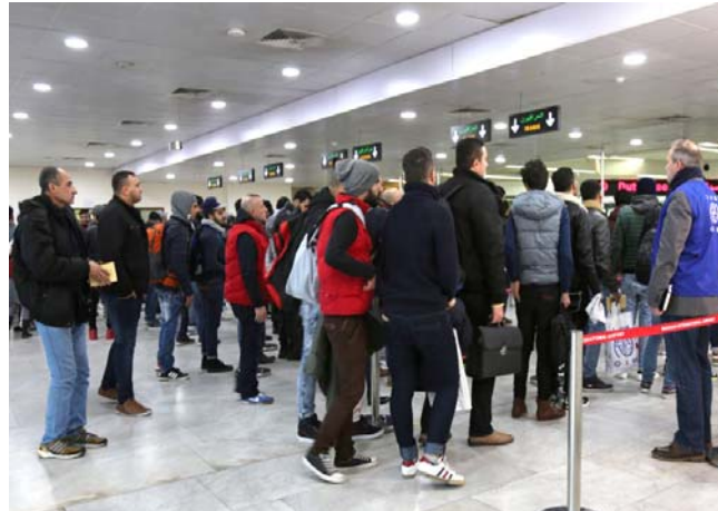
مهاجرون عائدون إلى العراق

بغداد - الأمانة العامة للتنظيم الدولية للهجرة اعلنت امس عودة اكثر من 4 آلاف مهاجر عراقي طوعاً من اليونان الى البلد خلال السنوات الثلاث الماضية من ضمن نحو 17 الف مهاجر من جنسية اخوتاروا العودة طوعاً الى بلدانهم الاصلية، وقالت المنظمة في تقرير ان (الفا 16 و 954 مهاجراً اختاروا العودة طوعاً من اليونان الى بلدانهم الاصلية خلال ثلاث سنوات، من حزيران 2016 حتى 28 آب 2019 موضحه ان (عدد المهاجرين من باكستان بلغ 1 الف و 292 مهاجراً تصدّرت قائمة تضم 83 جنسية عادت طوعاً بمساعدة المنظمة الدولية للهجرة، ثم من العراق 414 و 187