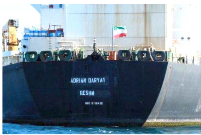
ناقله النفط الإيرانية

واشنطن - (ا ب ف) : أعلنت وزارة الخزانة الأمريكية أمس ان السلطات الأمريكية فرضت عقوبات على ناقلة النفط الإيرانية أدريان داريا - 1 المتهممة بنقل نفط الى سوريا رغم العقوبات - وعلى قبطانها، وقاتل الزوارية في بيجان أدريان داريا 1 تُعتبر ملكية محظورة وفقا لقار تنفيذي يستهدف الإرهابيين اولئك الذين يدعمون الإرهابيين او الأعمال الإرهابية . واصطفا ان قبطان الناقله اخليش كومار مستهدف ايضا بهذه العقوبات. وقالت الإدارة الأمريكية ان الناقله تحمل 2,1 مليون برميل من