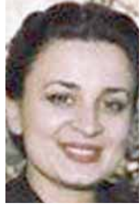
دينا عبد الحميد

□ عمان - ا ف ب - أعلن الديوان الملكي الأردني في بيان أمس الأربعاء وفاة الأميرة دينا عبد الحميد، أولى زوجات الملك الراحل حسين بن طلال ووالدة امته الأميرة عالية، ونعي الديوان (بمزيد من الحزن والتأخر، المغفور لها بآذن الله، سمو الأميرة دينا عبد الحميد، رحمها الله، والدة صاحبة السمو الملكي الأميرة عالية بنت الحسين، التي انتقلت إلى رحمة الله تعالى، أمس الأربعاء) في عمان، ومن المقرر أن يشيع جثمان الأميرة دينا ظهر الأربعاء إلى متواها الأخير بالمقابر الملكية في مراسم خاصة.