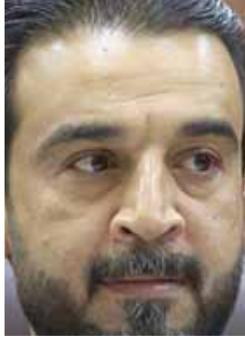
محمد الخبوسي الذي تستند إليه الدولة العراقية ويحتمل خلفه الشعب بكل أطيافه.

بغداد - الزمان أكد رئيس مجلس النواب محمد الخبوسي ضرورة دعم المؤسسة العسكرية والعمل على تشريع القوانين التي تسهم في تطويرها. وقال بيان مكتب رئيس البرلمان إن الخبوسي زار أمس وزارة الدفاع وكان في استقباله الوزير نجاح الشمسري وعدد من القيادة والضباط ونقل البيان عن الخبوسي قوله إن (مجلس النواب داعم للمؤسسة العسكرية وإنشاء الجيش العراقي بكل صنفه، ويعمل على تشريع القوانين اللازمة التي تسهم في بنائه وتطويره)، مؤكداً (تلبية احتياجاته من خلال تعزيز تخصصاته في الموازنة القادمة).