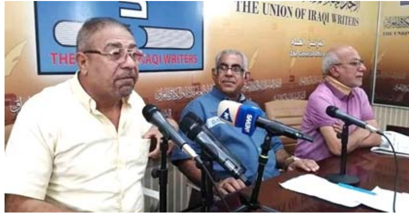
مسيرة ابداع؛ الملتقى الإذاعي والتلفزيوني يحظى باكرام كامل