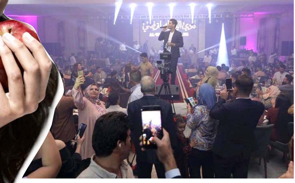
محمد عساف على خشبة عراقية

بغداد - الزمان احيا المطرب الفلسطيني محمد عساف اولي حفلاته الغنائية في العاصمة بغداد في رابع ايام عيد الاضحى المبارك في نادي اليرموك الترفيهي واستقبل جمهوره الكبير الذي اكتنفت بهم قاعة الحفل، بعد ان حجز مكاناً خاصاً في قلوب محبيه في العراق خصوصاً بعد ان غنى أغنية مكانك خالي باللهجة العراقية والتي افتتح بها الحفل كما قدم عساف مجموعة من أبرز أعماله الغنائية منها : اغنية بصراحة فيما قام بغنا اغنية لتشوفني تعبان للفنان علي صابر وغنى للفنانة رحمة رياض اغنية وعد مني كما قدم عدداً من الاغنيات باللهجة المصرية بالإضافة الى عدد كثير من اغنياته التي حققت نجاحاً كبيراً. واشتركت المطربة العراقية دموع تحسين مع عساف في احيا هذا الحفل.