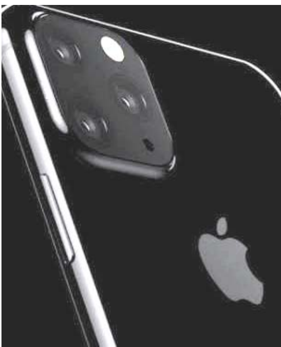
بقية الخبر على موقع (الزمان)

لندن - الزمان قال علماء إنهم تمكنوا من إعادة تركيب عطر يعتقدون أن أشهر فانتازات التاريخ، كليوباترا، كانت تتعطر به، وذلك بعد الكشف عما يظن العلماء أنه بيت صانع عطور، ضمن حفريات في موقع مدينة تيموس الفرعونية، التي بنيت عام 4500 قبل الميلاد. وتوصل الفريق إلى هذا الكشف بعد العثور على المصرية الأثرية عن ذلك. وعثر على وصفة العطر بعد عقد كامل من الحفريات قام بها فريق من علماء الآثار من جاماعة هاواي في موقع شمالي القاهرة يدعى تل التيمائي، وهو موقع مدينة تيموس الفرعونية، التي بنيت عام 4500 قبل الميلاد. وتوصل الفريق إلى هذا الكشف بعد العثور على