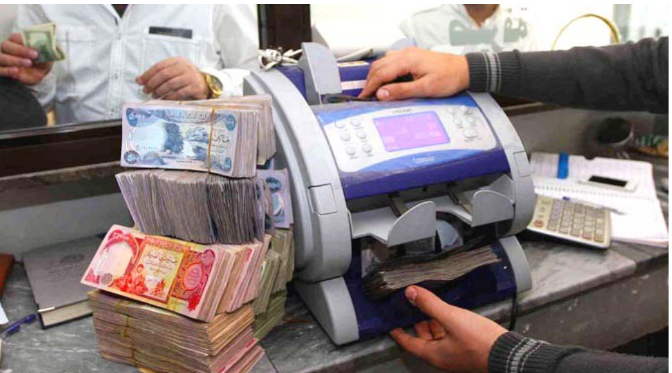
صرفاً: موظفة في مصرف تصرف مبلغاً لزبون

بغداد - الزمان حذر مصرف الرشيد موظفي دوائر الدولة والمتقاعدين والموظفة رواتبهم لدى المصرف من التعامل مع أي شركة تدعي الوساطة مع مصرف الرشيد لسلف والقروض عدا فروعه. وقال بيان تلقته (الزمان) امس ان (هناك بعض الشركات والمجمعات والكهنة المنتشرة في بغداد والمحافظات يمدون قبايعهم بترويج معاملات السلف والقروض لقاء مبالغ معينة ومنها شركة الوسام مستغلين بذلك اسم المصرف لترويج تلك المعاملات خارج صلاحيتهم). ودعا المصرف المواطنين الى عدم التعامل مع مثل هذه الجهات التي تدعي ترويج السلف والقروض وان ادارة المصرف ستتحقق من الاجراءات القانونية الرادعة بحق هؤلاء. علما ان جمع السلف التي يمنحها المصرف تكون عن طريق بطاقة نخل ماستر كارد حصراً). واعلن مصرف الرافدين عن المباشرة بتوزيع رواتب المتقاعدين المدني والعسكري لشهر اب وقال (تم صرف رواتب المتقاعدين المدني والعسكري لشهر اب عن طريق انوات الدفع الالكتروني). وأضاف انه (بإمكان المتقاعدين المدني والعسكري تسلم رواتبهم الشهرية من أي مكان يتواجد فيه). وكانت لجنة التقاعد الوطنية قد اعلنت في ايار الماضي، عن موافقة وزارة المالية على دفع رواتب المتقاعدين المدنيين والعسكريين شهرياً بدلاً من شهرين.