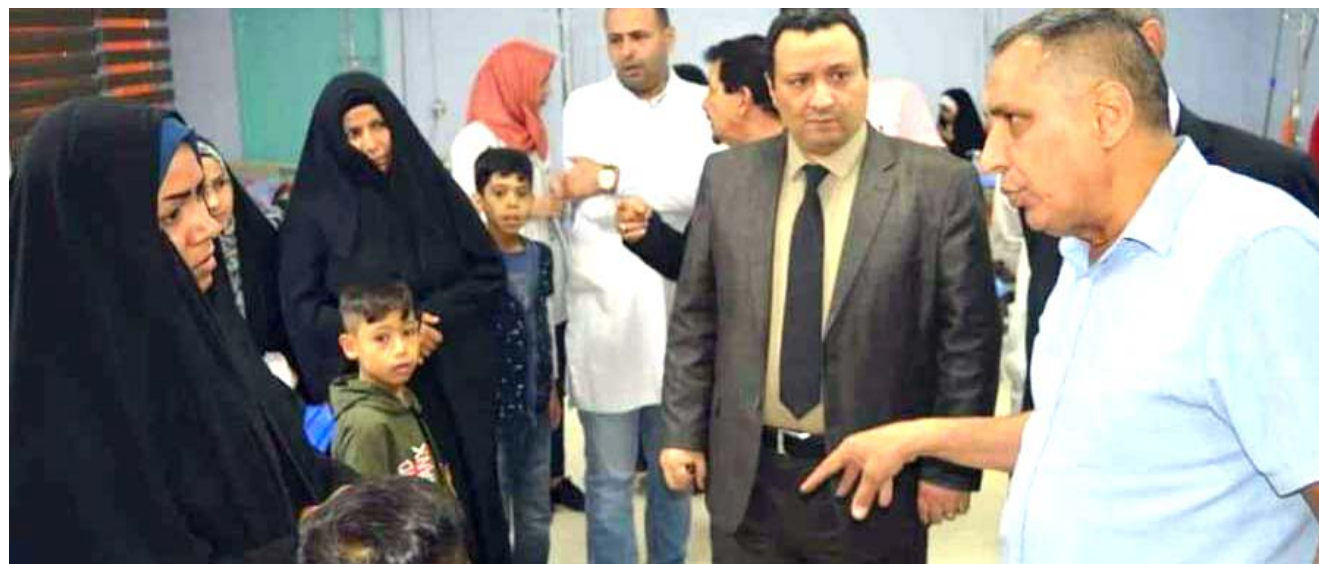
زيارة: ممثل لجنة رعاية الطفولة خلال زيارته إلى مستشفى الزهراء

ويعمل وفق البية تتضمن بيانات المريض تتضمن الاسم السن النوع، انواع التحاليل يتم انخالها لقاعدة البيانات). مضيفاً (بعدها يطبع شرائط الباركود الخاصة بالمرضى ليتم لصقها على اناسيب الإختبار). وبين الغزالي ان قارئ الباركود الموجود بكل جهاز يقوم باجراء تحليل تلقائياً بقراءة البيانات الموجودة بشرط الباركود، ويقوم بمراجعة تلك البيانات مع الكمبيوتر