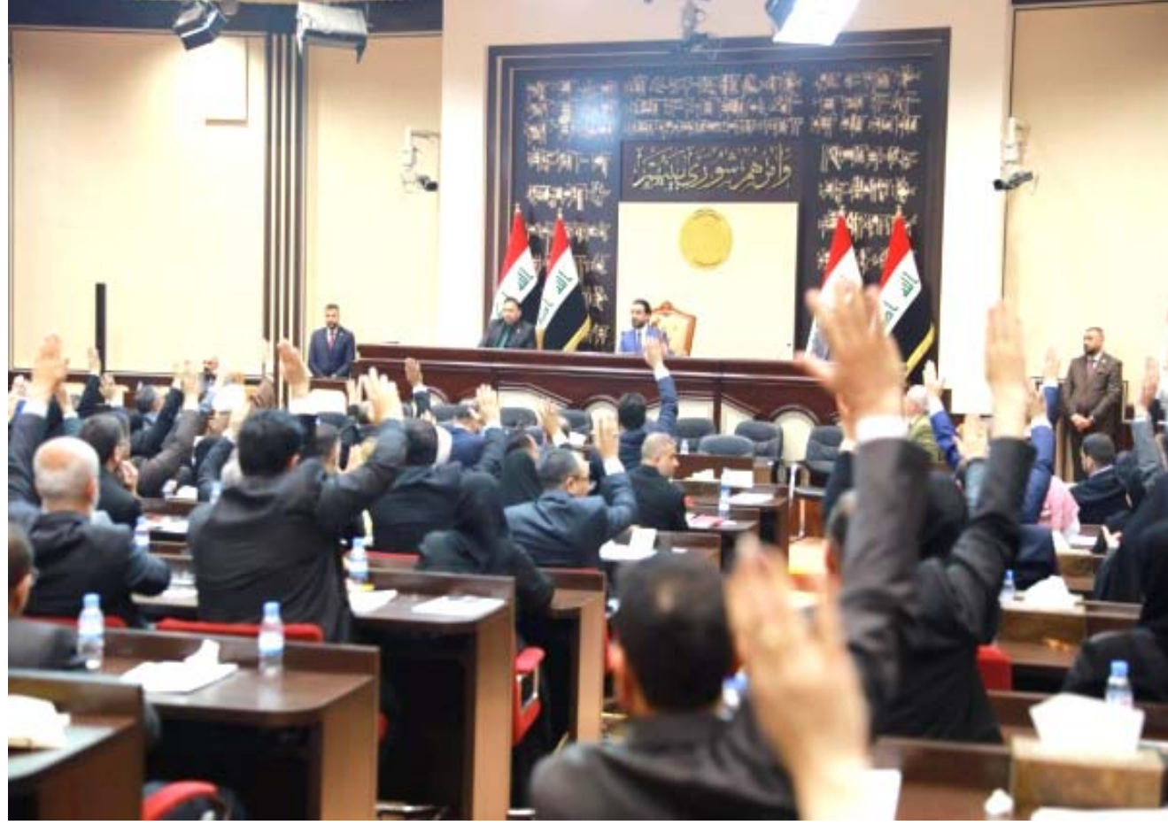
جلسة: جانب من الجلسة الختامية للفصل التشريعي

وأعلن رئيس مجلس النواب محمد الحلبوسي نهاية الفصل التشريعي الثاني بعد تعديده إلى شهر واحد، وبدء العطلة التشريعية للنواب التي تستمر 30 يوماً. وقال الحلبوسي في بيان إن (يوم السبت الموافق 3 آب هو نهاية الفصل التشريعي الثاني السنة التشريعية الأولى للدورة النيابية الرابعة) ودعا الحلبوسي في بيانه أعضاء مجلس النواب إلى الاستمرار